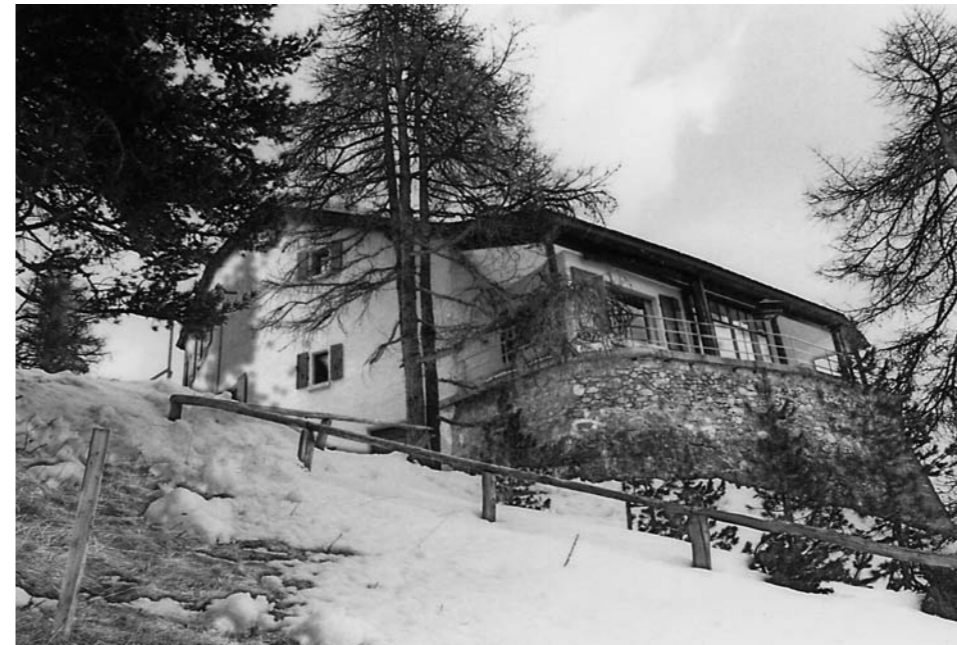
Die Villa Böhler in St. Moritz wurde 1989 in einer Nacht- und Nebelaktion abgebrochen.

Ebenso wichtig ist aber die Hebung der fachlichen Kompetenz der Architekten und der andern Bauberufsleute. Was in dieser Hinsicht zur Zeit in der Schweiz geschieht, stimmt mich hoffnungsvoll – selbst in der Zeit des Sparens um des Sparens willen, das nicht nur den Denkmalpflegestellen, sondern, was noch viel wichtiger ist, dem Bestand der Schweizer Denkmälerlandschaft nachhaltig schadet.