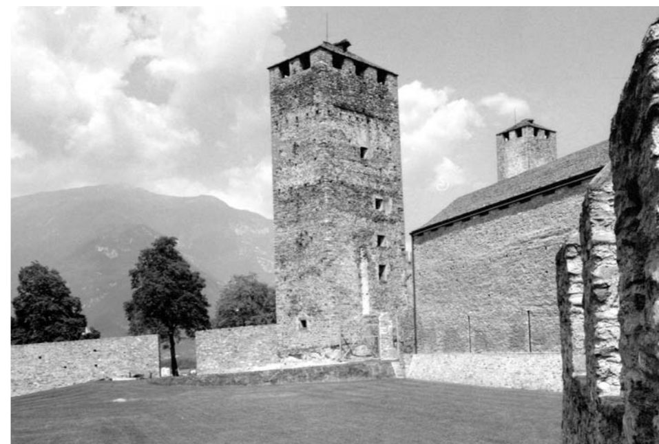
Nach dem architektonisch – aber nicht unbedingt denkmalpflegerisch – geglückten Eingriff in den Jahren 1983–89: Das Castelgrande in Bellinzona.