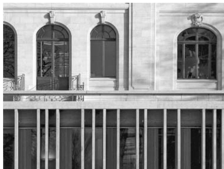
Le contraste de deux architectures qui renvoient à des réalités fonctionnelles et sociales d'époques différentes, détail de la façade nord-ouest.

Ein Beispiel dafür ist der Sitz der 1889 gegründeten Interparlamentarischen Union (IPU). Seit 1921 ist die IPU in Genf beheimatet, 2003 bezog sie das ehemalige Haus Gardiol in Grand-Saconnex. Das neoklassizistische Gebäude wurde 1906 vom Genfer Architekten Marc Camoletti, der auch das Musée d'Art et d'Histoire baute, errichtet. Auf Grund der Hanglage des Grundstücks ist seine Front nach Nordwesten gegen den Jura gerichtet. Die Ausstattung ist reich an Tapisseries, Tapeten, bunten Glasfenstern oder Dekorationsmalerei, die ein Panorama des Kunsthandwerks seiner Entstehungszeit wiedergeben. Als Boden wechseln Parkett, kolorierter Zement und Linoleum, das Teppichmuster imitiert, ab. Seit 1990 steht das Haus unter Schutz, 1999 wurde es von der Stadt Genf gekauft und der IPU angeboten. Für die Restaurierung und Erweiterung wurde im Jahr 2000 ein Wettbewerb ausgeschrieben und unter sechs Projekten dasjenige der Architekten Ueli Brauen und Doris Wälchli ausgewählt. Während das historische Gebäude nach den Vorgaben der Denkmalpflege sanft renoviert wurde, erstellte man für Konferenzräume, Bibliothek und Cafeteria eine Erweiterung im Erdgeschoss unter der alten Terrasse. Sie ist geprägt von einer Fassade aus Betonrippen, mit unterschiedlichen Abständen, die einem aleatorischen Muster folgen, das auf der Zahl Pi aufbaut. Der Kontrast der beiden Architekturen verleiht dem Gebäude eine neue Identität.