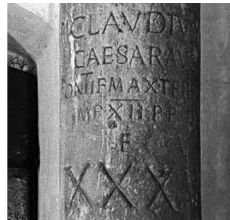
Fig. 3: Milliaire de l'empereur Claude conservé dans l'église de Saint-Saphorin VD. Daté de 47 ap. J.-C., il indique une distance de 37 milles (env. 55 km) jusqu'à Martigny (abrégée F pour Forum Claudii Vallensium).

pour gagner soit Zurzach AG ( Tenedone ) et Schleithem SH ( Iulio mago ), soit Bregenz ( Brigantio ), par Arbon TG ( Arbor felix ). Au sud-est, le franchissement des Alpes au départ de Côme par les Grisons et Coire ( Cuira ) est également attesté.