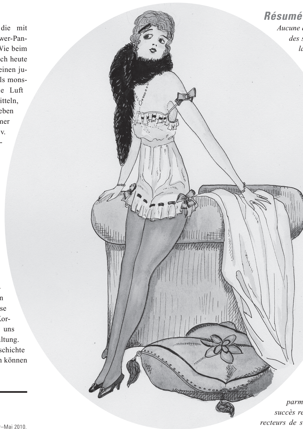
Modeabbildung für Unterwäsche, Illustration: Barlog, 1920.

Isabella Belting. Mode sprengt Mieder: Silhouettenwechsel . Katalog zur gleichnamigen Ausstellung im Münchner Stadtmuseum, Januar–Mai 2010. München, Hirmer, 2009. 144 Seiten mit zahlreichen Abbildungen in Farbe und Schwarz-Weiss. CHF 43.50. ISBN 978-3-7774-2491-0