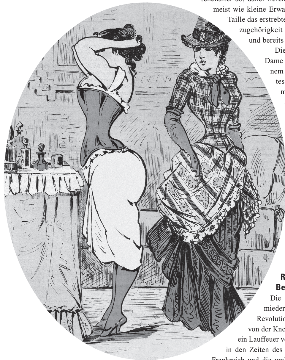
Zeichnung von E. Tacchi, aus: Il diavolo Rosa, 1883.

Im Rokoko war die Schnürung von Kindern Voraussetzung dafür, auf dem Heiratsmarkt mitspielen zu können. Im 18. Jahrhundert setzte sich die Kindheit noch nicht als eigenständige Lebensphase von dem Erwachsenenalter ab, daher liefen die Kinder der höheren Stände meist wie kleine Erwachsene herum. Da eine schmale Taille das erstrebte Zeichen einer höheren Standeszugehörigkeit war, musste sie um jeden Preis und bereits sehr früh «angelegt» werden.