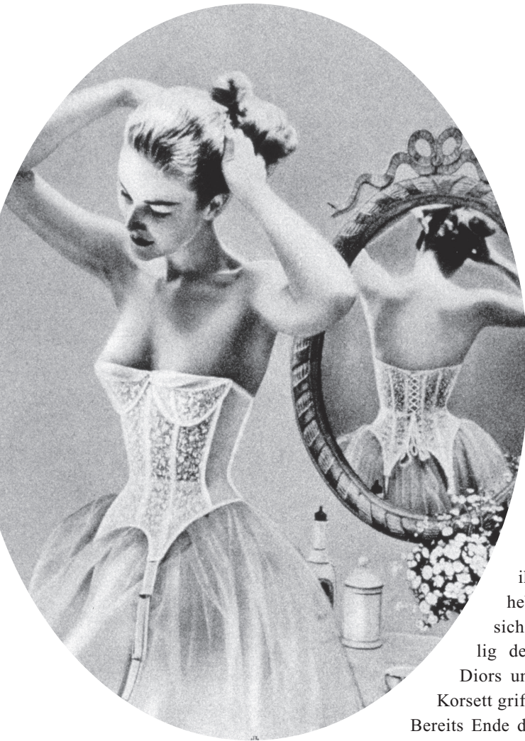
Anzeige für Perlon-Corselettchen. Aus: Madame, 1952.

genden Jahrzehnt in mehreren Variationen das Leitbild der Haute Couture. Nach den entbehrungsreichen Kriegs- und Nachkriegsjahren wurde der New Look mit Begeisterung begrüßt. Endlich konnte sich die Frau wieder als Frau fühlen und ihre Weiblichkeit hervorheben. So erklärt sich, dass sich die Damenwelt bereitwillig dem Modediktat Christian Diors unterwarf und wieder zum Korsett griff.