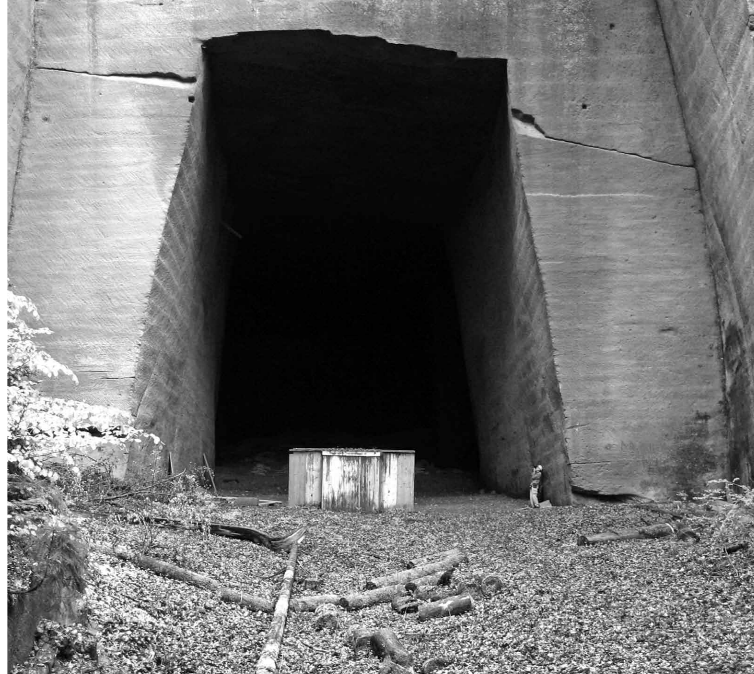
Steinbruch Oberburg: Historischer Abbau von Berner Sandstein.

Während Festgesteine für Bauzwecke sowie für die Ziegel- und Zementindustrie heute noch wirtschaftlich abgebaut werden, haben Energierohstoffe wie Kohle oder Erdöl, sowie Erze in der Schweiz zurzeit keine wirtschaftliche Bedeutung mehr. Die Nachfrage der Industrie nach umfassenden Inventaren von Vorkommen mineralischer Rohstoffe in der Schweiz ist daher gering. Sie allein könnte eine weitere Inventarisierung nicht rechtfertigen. In zunehmendem Masse sind aber Politik, Wissenschaft und Öffentlichkeit (Museen, kulturhistorische Institutionen, Naturpärke) an Daten interessiert. So trat im Jahr 2007 das Bundesgesetz über Geoinformation (GeoIG) in Kraft, dem auch die SGK durch Leistungsvereinbarungen mit der Landesgeologie (swisstopo) untersteht. Dieses Gesetz schreibt vor, dass Geodaten