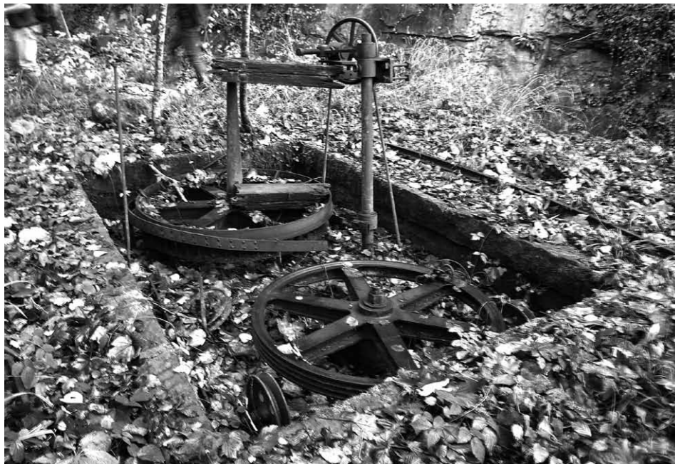
Relikte einer wohl bald 100-jährigen Förderanlage des Zuger Sandsteins, in Lotenbach (ZG).