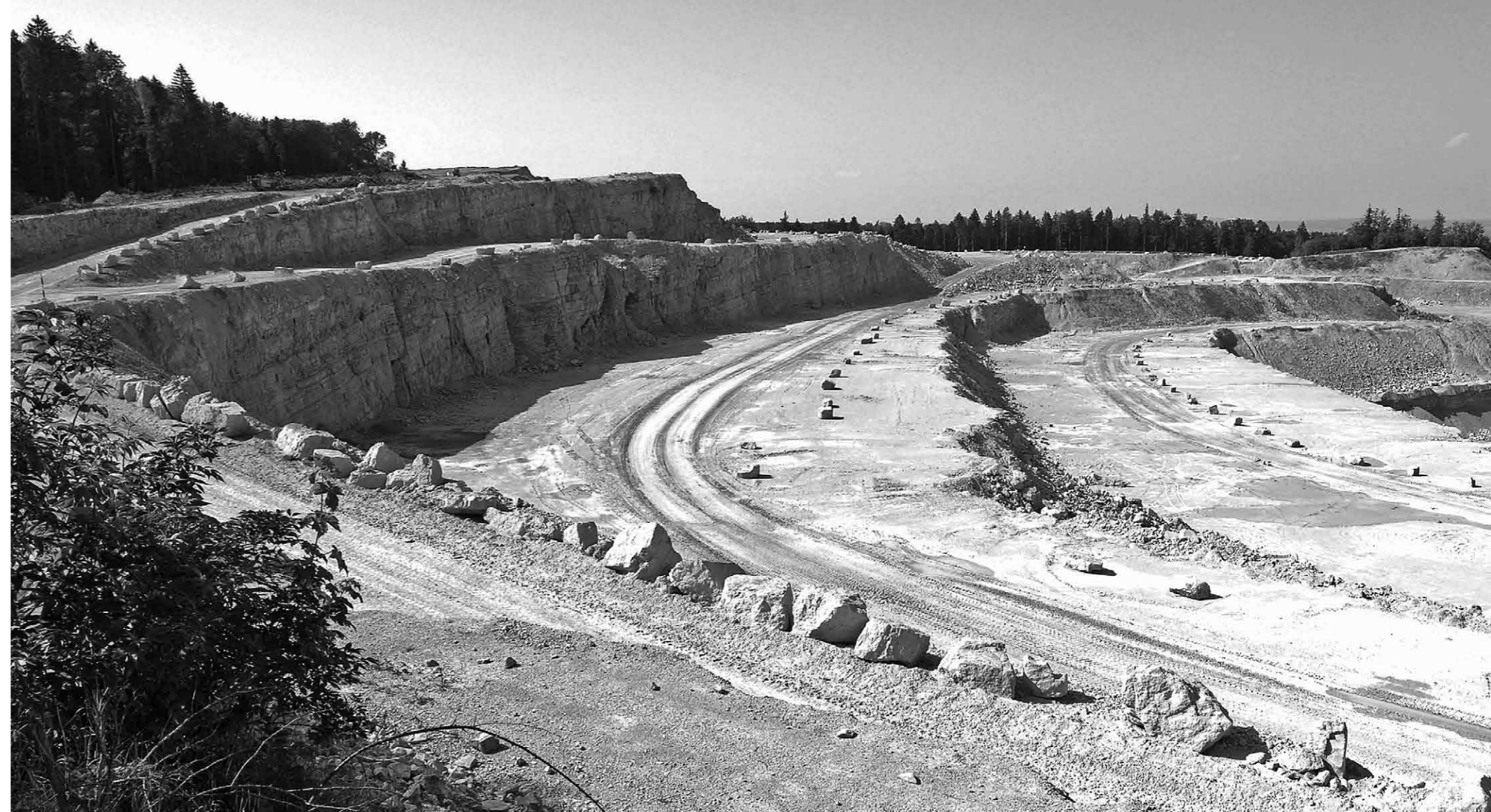
Steinbruch Gabenchopf bei Villigen (AG). Jurakalk wird hier für die Herstellung von Portlandzement abgebaut. Es ist ein aktueller, grossräumiger Abbau, der dank seiner geschützten Lage im Landschaftsbild jedoch kaum wahrgenommen wird.

Das grosse Interesse am Rohstoff Stein führte 1899 zur Gründung der Schweizerischen Geotechnischen Kommission SGTK, deren Hauptauftrag in den Statuten vom 23. Juni 1900 folgendermassen festgeschrieben ist: «Die Kommission übernimmt im Auftrage der Bundesbehörden oder nach eigenem Ermessen Untersuchungen, welche die genauere Kenntnis des Bodens der Schweiz bezüglich einer industriellen