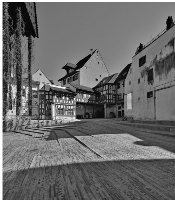
Fügt sich gut in die historische Umgebung ein: der sanft gestufte Eingangshof des Museums der Kulturen in Basel.

In der Auswahl von Pro Infirmis Basel wurden explizit Bauten berücksichtigt, bei denen die Massnahmen zugunsten behinderter Menschen den Kriterien der Gleichstellung entsprechen und somit möglichst alle, also auch nicht behinderte (z.B. ältere) Besucher profitieren. Wichtig für die Beurteilung war im Weiteren, dass nicht separierende Lösungen verwirklicht wurden,