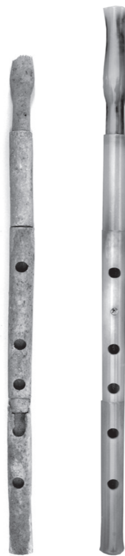
Links: Originaler aulós aus Hirschknochen, aus Paestum. Rechts: Nachbau aus Hirschknochen, mit Leinöl behandelt

ten Hand über einzelne Saiten führte. Damit nicht stets alle Saiten zur selben Zeit in Schwingung versetzt wurden, mussten die Finger der linken Hand die anderen Saiten dämpfen. Diese Art «Negativtechnik», wo als Ausgangslage die fünf Finger auf den Saiten liegen und nur bei Bedarf einzeln aufgehoben werden, finden wir nicht nur auf zahlreichen Vasen deutlich abgebildet; sie ist noch stets lebendig im heutigen Ägypten auf vergleichbaren Instrumenten wie tambura oder semsemeia , ebenso auf dem äthiopischen kharr . Ein sowohl kraftvolles wie auch rhythmisch prägnantes Spiel wird die Folge dieser instrumententypischen Spielweise gewesen sein.