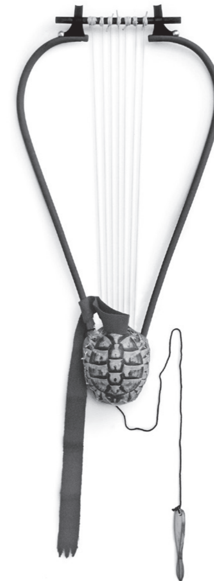
Moderner Nachbau eines Barbitos.