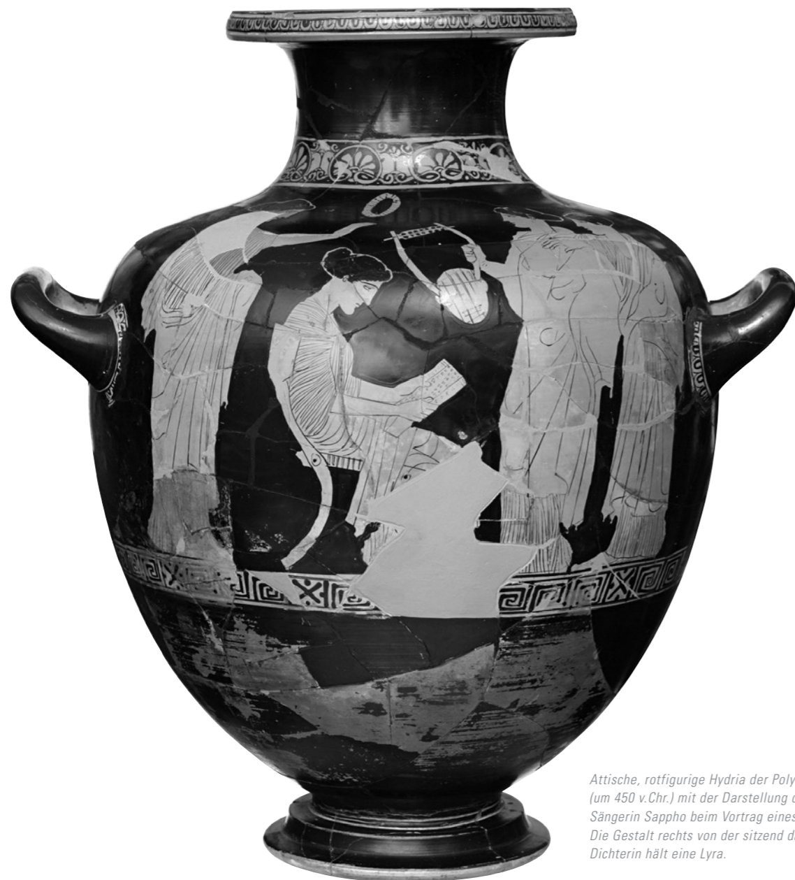
Attische, rotfigurige Hydria der Polygnotos-Gruppe (um 450 v.Chr.) mit der Darstellung der Dichterin und Sängerin Sappho beim Vortrag eines ihrer Gedichte. Die Gestalt rechts von der sitzend dargestellten Dichterin hält eine Lyra.