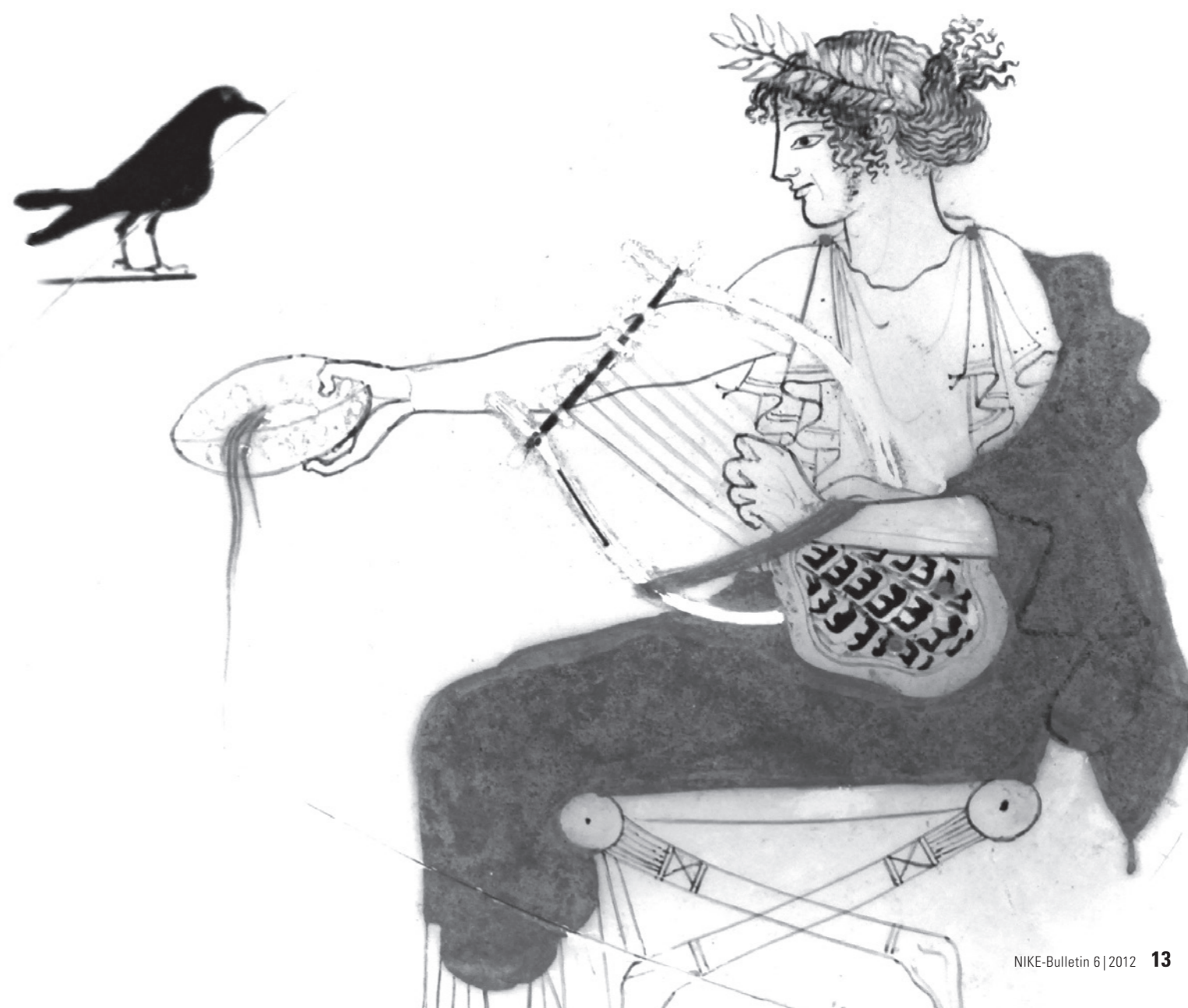
Darstellung des Gottes Apoll mit einer Lyra auf einer attischen Kylix (Trinkschale), um 480–470 v. Chr.

wurde, was kein oktavierendes Überblasen erlaubte. Die gesamte Disposition ergab ein dynamisch gleichförmiges, aber melodisches und zudem immer zweitöniges Spiel. Diese Zweitönigkeit konnte zustande kommen, indem eine Röhre einen Halbton (Bordun) spielte, oder indem beide Röhren sich in einem gewissen Rahmen melodisch bewegten. Formelhaftigkeit der Ausdrucksweise wird in jedem Fall auch hier eine grosse Rolle gespielt haben. Diese Art Klang und Spiel finden wir noch heute, wiederum in Ägypten, auf den Instrumenten magruna und arghoul , ebenso wie auf der sardischen launeddas . Es sind Techniken und Ausdrucksweisen, die eine