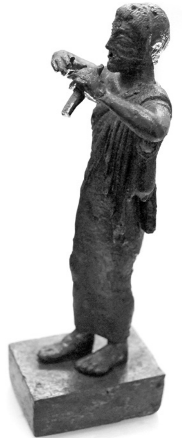
Bronzefigur eines Aulos-Spielers, aus einer korinthischen Werkstatt, 500–490 v. Chr.

Und hier beginnt die Geschichte, interessant zu werden. Zur Erziehung eines freien Athener Bürgers – also keines Fremden, keines Sklaven und auch keines Mädchens oder gar einer Frau – gehörte der Unterricht im Instrumentalspiel und Gesang. Die sieben-saitige lyra mit der Schale einer Schildkröte als Resonanzkörper galt als wertvoll, der doppelt geblasene aulós war nur zeitweise erzieherisch anerkannt. Auch wenn nun ein Athener gewisse instrumentale Fähigkeiten erworben hatte: