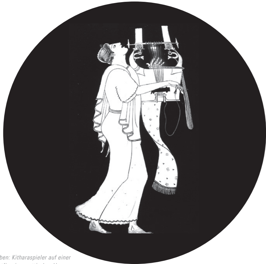
Oben: Kitharaspieler auf einer rotfigurigen, attischen Vase.