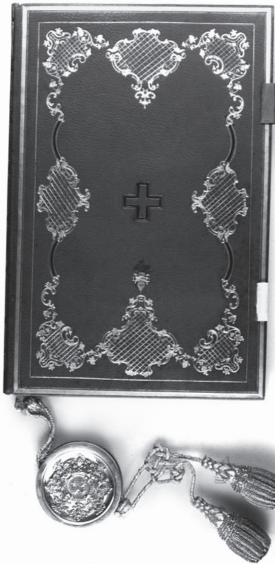
Die Bundesverfassung der Schweizerischen Eidgenossenschaft von 1848: Grundlage der modernen Schweiz – über den wegweisenden Inhalt hinaus ein wertvolles «Objekt».

Archive schaffen also die Bedingungen der Möglichkeit künftiger Erkenntnis. Archivgut besteht aus überlieferten Arbeitsinstrumenten und nicht aus Werken etwa im Sinne des Urheberrechts. Es ist in diesem Sinne eine auszubeutende Ressource (die bei der intellektuellen Ausbeutung keinen Schaden nimmt), bei der die Inhalte im Zentrum stehen, jenseits aller ästhetischen oder anderen kulturell bedeutsamen Objektqualitäten. Es geht nicht um bewundernde Betrachtung musealisierter Objekte, sondern um aktive Auseinandersetzung. Archive waren immer Werkstätten oder Laboratorien. Archive sind Teil einer Infrastruktur zur Versorgung der Gesellschaft mit den Informationen, welche die Wahrung bestehender Rechte ermöglichen, die Entstehung jeweiliger Gegen-