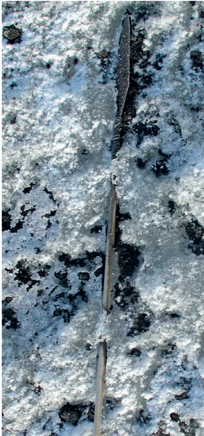
Eisenzeitlicher Pfeil aus Løpesfonna/Norwegen.

gen Fundkomplex des 5300 Jahre alten Südtiroler Eismannes im September 1991 deutlich geworden. Doch die Ikone Ötzi war nicht allein. Aussergewöhnliche prähistorische Funde, wie sie zuletzt am Schnidejoch und Lötschenpass im Berner Oberland, aber auch in Südtirol und weiteren Gebieten der Alpen mehrfach gemacht wurden, belegen, dass es sich beim Phänomen von im Eis konservierten Artefakten keineswegs um beliebige Einzelfälle handelt. So lässt sich im skandinavischen und nordamerikanischen Raum eine regelhafte Häufung von organischen und anderen archäologischen Objekten über den Verlauf der letzten Jahrtausende im Bereich sogenannter Ice Patches fassen. Der konzentrierte und wiederholte Fundniederschlag in diesen permanent am Untergrund festgefrorenen und daher mitunter mehrere Jahrtausende alten Eisflecken steht hier im Zusammenhang mit einer auf die entsprechenden Zonen ausgerichteten Jagdstrategie bzw. ungebrochenen Jagdtradition (sommerliche Rentier- bzw. Karibujagd). Die relative Berechenbarkeit eines solchen Deponierungsmusters hat bereits vor über zehn Jahren zum Einsatz von GIS-gestützten Vorhersagemodellierungen zur systematischen und rechtzeitigen Bergung entsprechender Funde aus dem Eis geführt. Diese Vorgehensweise hat sich im Laufe der letzten Jahre in