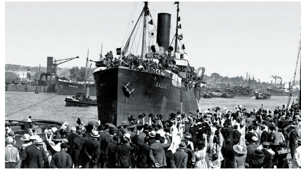
... ein Bild aus dem Filmarchiv des Internationalen Komitees vom Roten Kreuz IKRK: Deutsche Kriegsgefangene an Bord des Schiffs Bagdad, Stettin 1921.

(herunterzuladen bei den Dokumenten von www.memoriav.ch ) ist imposant. Er belegt die Jahresleistung der vier von Milizverantwortlichen aus den jeweiligen Branchen geleiteten «Kompetenznetzwerke»: Fotografie, Ton/Radio, Film, Video/TV. Unter den durch Digitalisierung «verewigten» Trouvaillen der vier Kompetenzbereiche wären als beispielhaft zu nennen: die Sicherung des Nachlasses des Farbfotografie-Pioniers Emil Schulthess (1913–1996), die Erhaltung von Tonaufnahmen des Radio-Komponisten und «Glückskette»-Gründers Jack Rollan wie auch die Nacherschliessung des aufmüpfigen SF-Vorabendmagazins Karussell (1977–1988), die Restaurierung von 12 Filmkopien des unbequemen Gestalters Alexander J. Seiler (geb. 1928) mitsamt leidenschaftlichen Echos, oder auch der Transfer des Filmarchivs aus den Kellern des Internationalen Komitees vom Roten Kreuz IKRK. Der Verein Memoriav rühmt sich seiner «220 erfolgreich durchgeführten Projekte und der Rettung von 1 Million audiovisueller Dokumente» (seit 1995, Referat Stuehn).