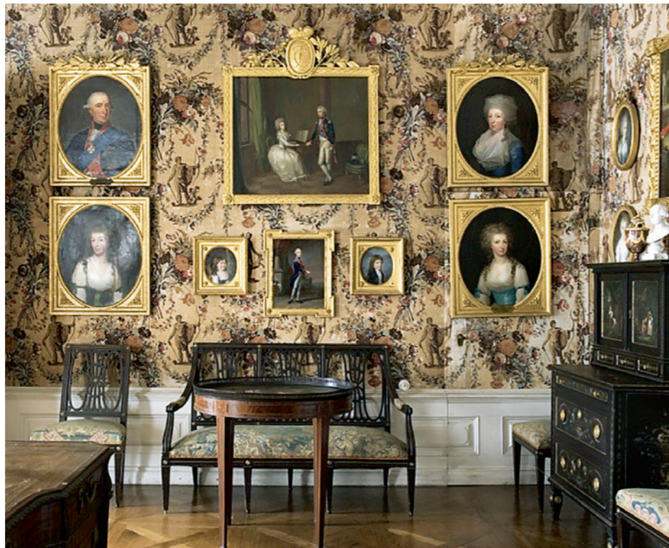
Abb. 7: Fulda (Deutschland/Hessen), Schloss Fasanerie, Landgrafenzimmer. Neuenburger Indiennes um 1820 aus der Manufaktur Vauvilliers-Boudry NE.