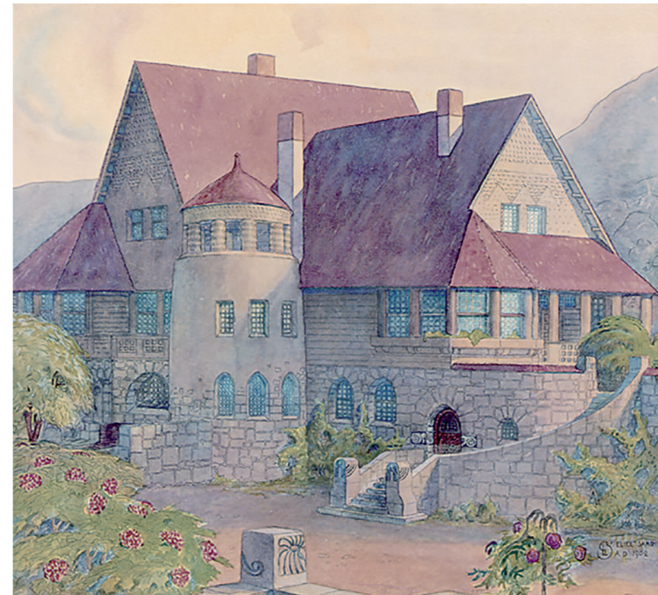
Abb. 2: Entwurf für ein Wohnhaus in Hvittorp bei Helsinki (Suomi/Finnland), Eliel Saarinen 1904. Die gleiche plastische Stein-Architektur mit Fensteröffnungen vom Keller bis ins Dach.