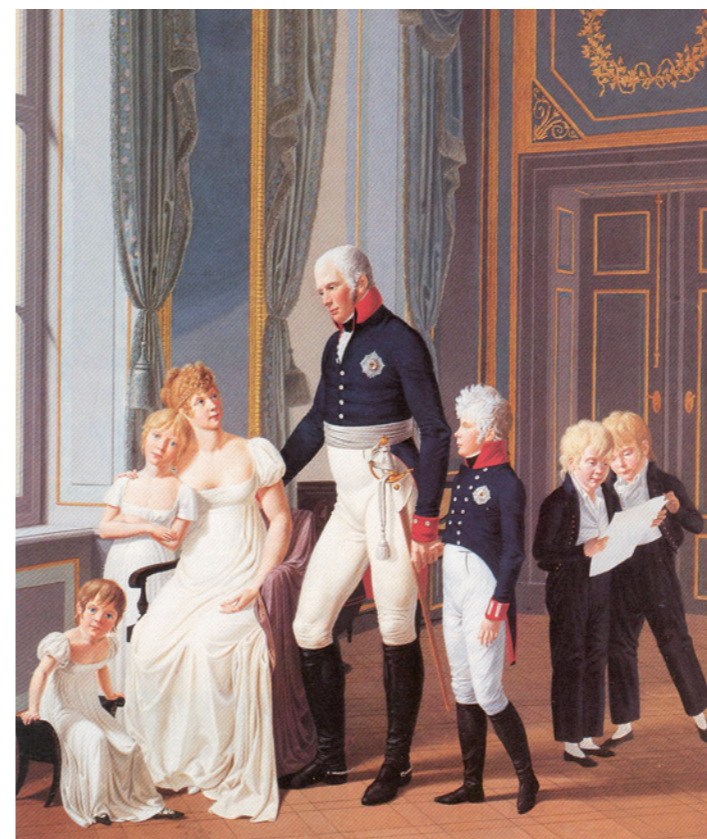
Abb. 6: König Friedrich Wilhelm III. und Königin Luise im Kreis ihrer Kinder. Rechts aussen der fünfjährige Prinz Carl, an der Hand des Vaters Kronprinz Friedrich-Wilhelm (IV.). Gouache von Anton Dähling 1806.

Das Schweizerhaus im Chaletstil ist heute globalisiert. Wir finden es in Osnabrück als Diskothek, in Frankfurt als Gärtnerhaus einer Villa, im Wiener Prater als Vergnügungsort, in Opatajia als Kroatisches Museum, in Honkong als Chickenrestaurant. Im Etosha National Park in Namibia