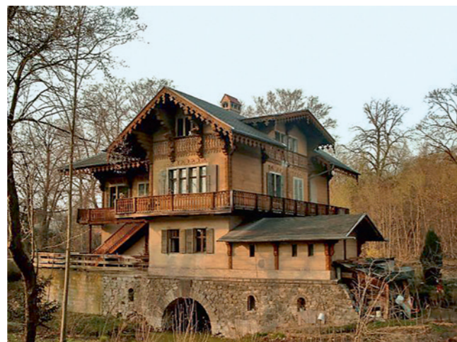
Abb. 5: Klein-Glienicke, Berlin-Potsdam, Schweizerhaus von Prinz Carl am Bäkekanal, um 1860.

Doch schon im Ancien Régime gab es Schweizerhäuser in den Parks der europäischen Aristokraten, so in den Zarenresidenzen um Sankt-Petersburg oder im Schlosspark Ludwigslust in Mecklenburg. Berühmte Schweizerhäuser oder Swiss cottages stehen im Park des Landsitzes Osborne auf der Isle of Wight (1854), auf der Pfaueninsel bei Berlin (1830, Karl Friedrich Schinkel, für Friedrich Wilhelm III. von Preussen) und in Klein-Glienicke in Potsdam. Von den dort ehemals zehn Schweizerhäusern am Bäkekanal sind vier noch erhalten (Abb. 5). Sie wurden 1859–1867 auf Veranlassung von Prinz Carl von Preussen erbaut. Carl (Abb. 6) war gewissermaßen ein «Heimwehsschweizer», da sein Vater Friedrich Wilhelm III., der König von Preussen, zugleich Fürst von Neuenburg war. Seit 1814 war Neuchâtel eidgenössischer Kanton und preussisches Fürstentum. Carls kultisch verehrte Mutter, die charman-