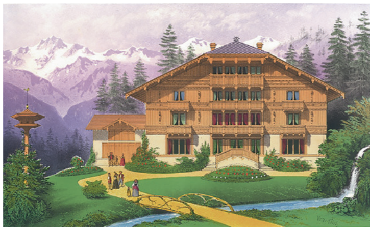
Abb. 4: Habitations cosmopolites. Typ «Chalet Suisse ct. Berne», von Victor Petit, Paris Monrocq, Mitte 19. Jahrhundert.