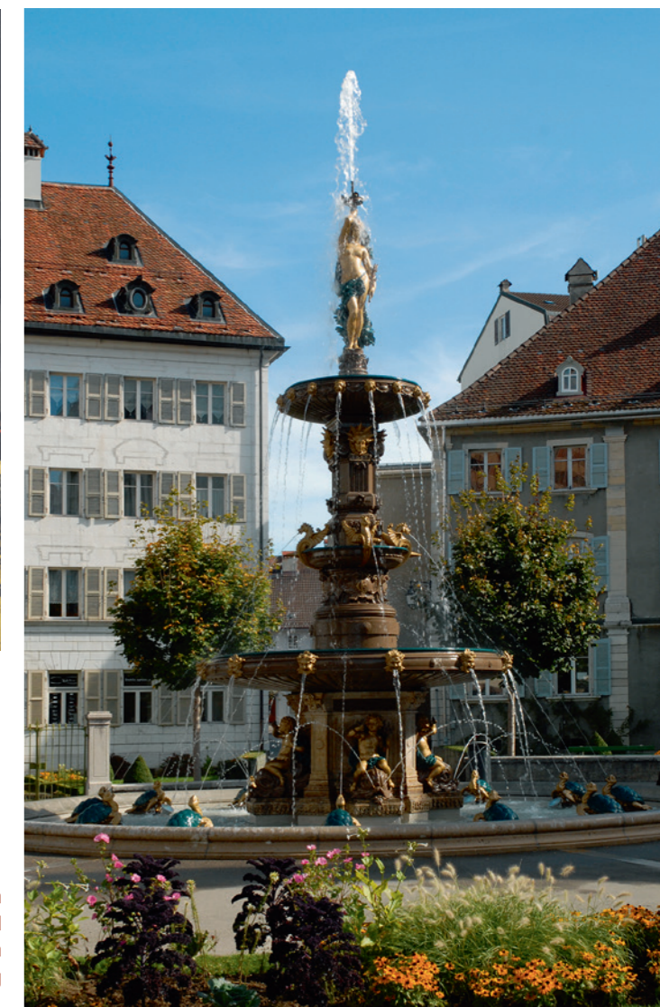
Der grosse Springbrunnen am Anfang der Avenue Léopold Robert, der an den Beginn der Wasserversorgung 1887 erinnert.