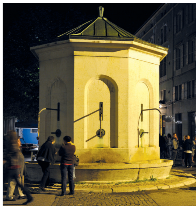
Die Fontaine de six pompes diente der Wasserversorgung vor dem Bau der grossen Trinkwasseranlage aus der Areuse.