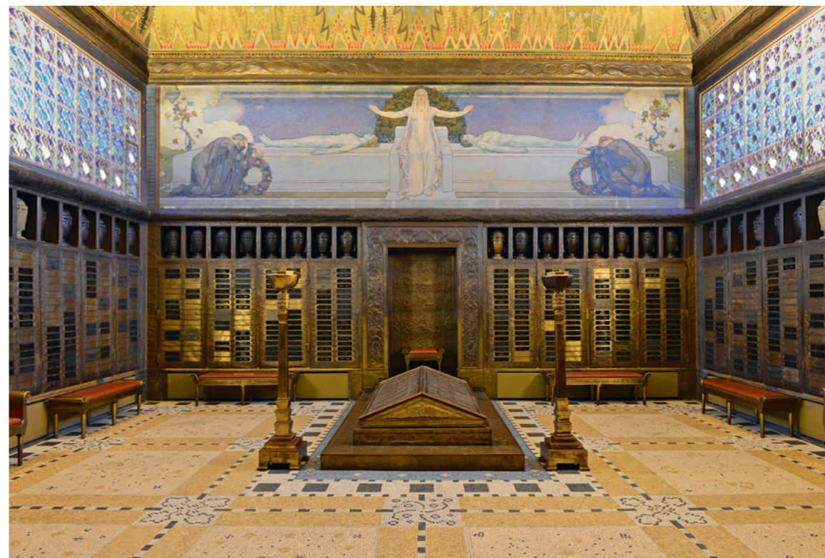
Das Innere des Krematoriums auf La Charrière, gestaltet 1908–1909 von Charles L'Éplattenier und den Ateliers de l'art réunis.

Die Grossstadt auf den Jurahöhen, auf fast 1000 Metern Höhe, brauchte eine entsprechende Infrastruktur: Der Grand Temple auf der kleinen Kuppe beim Rathausplatz erhielt 1851 «Konkurrenz» durch den Temple Allemand, 1876 durch den Temple Farel, 1904 durch den Temple de l'Abeille und 1967 durch den Temple St-Jean. Die Katholiken bauten 1927 die Kirche Sacré-Coeur, die jüdische Gemeinde 1894 die Synagoge. 1908 entstand auf dem Friedhof von La Charrière das wohl eindrucklichste Krematorium der Schweiz. Die Künstlervereinigung «Ateliers réunis» schmückte es innen und aussen mit Mosaiken, Wandmalereien, getriebenen Kupferreliefs und Urnen aus Bronze-guss.