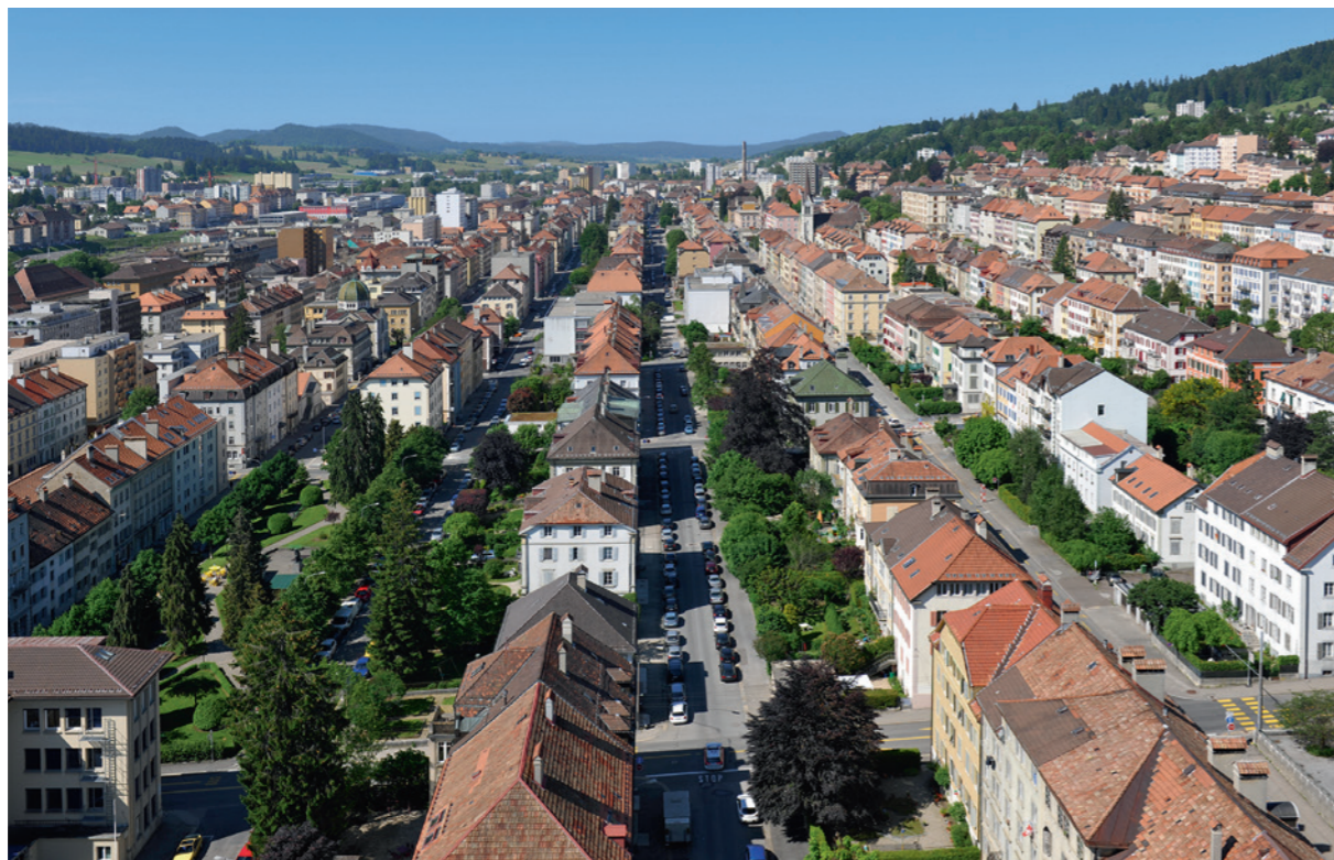
Häuser, Gärten und Strasse an der rue de la Paix.