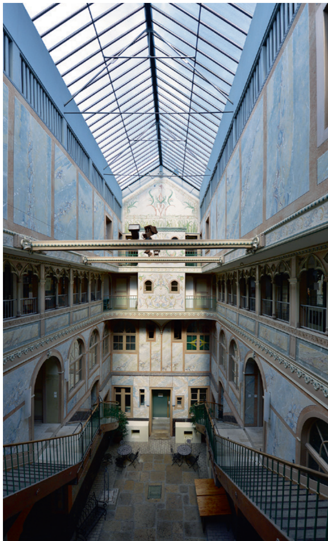
Ancien manège, 1868 in die ehemalige Reithalle von 1862 eingebaut, bis 1972 als «Familistère» bewohnt und 1985 vor dem Abbruch gerettet. Blick in den 1992–1994 restaurierten Innenhof.