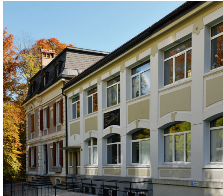
Uhrenfabrik Coulleru Meuri, seit 1892 Léon Breitling, rue Monbrillant 1-3. An das Bürohaus schliesst die Fabrikantenvilla an; Architekt Eugène Schaltenbrand (1861– ca. 1930).