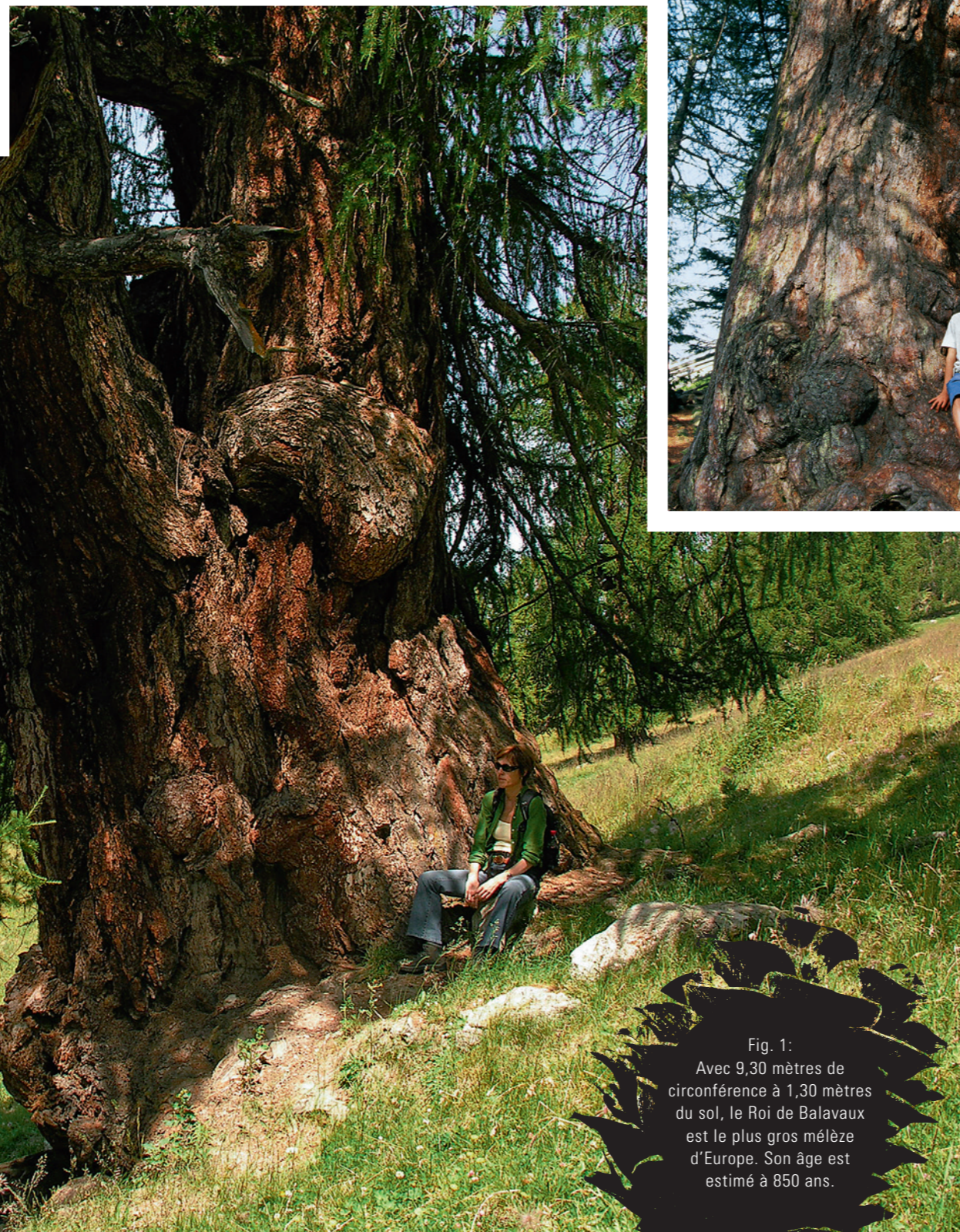
Fig. 1: Avec 9,30 mètres de circonférence à 1,30 mètres du sol, le Roi de Balavaux est le plus gros mélèze d'Europe. Son âge est estimé à 850 ans.

Lors d'une promenade en forêt, nous avons tous eu un jour l'envie de compter les cernes visibles sur une bille entreposée en bordure du chemin. Cet exercice, qui demande une certaine dose de patience, permet de connaître, à quelques années près, l'âge de l'arbre dont elle est issue, mais aussi, de découvrir que ces anneaux peuvent être étroits ou, au contraire, de grande taille... Ce faisant, nous avons pratiqué, sans le savoir vraiment, une méthode de datation appelée «dendrochronologie».