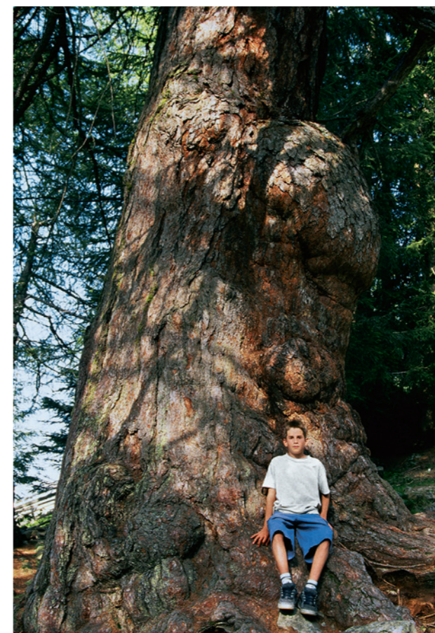
Fig. 2: Le géant de Sankt-Gertraud. Ce très beau mélèze fait partie d'un triumvirat d'anciens niché au fond de l'Ultental (Südtirol/Trentino). Il est âgé d'environ 850 ans et mesure 8,43 mètres de tour de taille.

découverte au début du XX e siècle, la dendrochronologie est une science qui permet l'analyse des anneaux de croissance des arbres. Elle s'attache essentiellement, mais pas exclusivement, à la mesure des cernes, à leur description et à leur ordonnance dans le temps (datation). A titre comparatif, les «codes-barres», inhérent à notre environnement domestique et commercial, sont omniprésents sur les emballages des produits que nous achetons; ils contiennent toutes les informations essentielles à la gérance de ces derniers. Dans l'environnement naturel qui nous entoure, depuis des milliers d'années, les arbres enregistrent des «codes-cernes», en fonction des influences climatiques qu'ils subissent. Pour les dendrochronologues, dont c'est le métier, le but est de lire et de décrypter ces signaux.