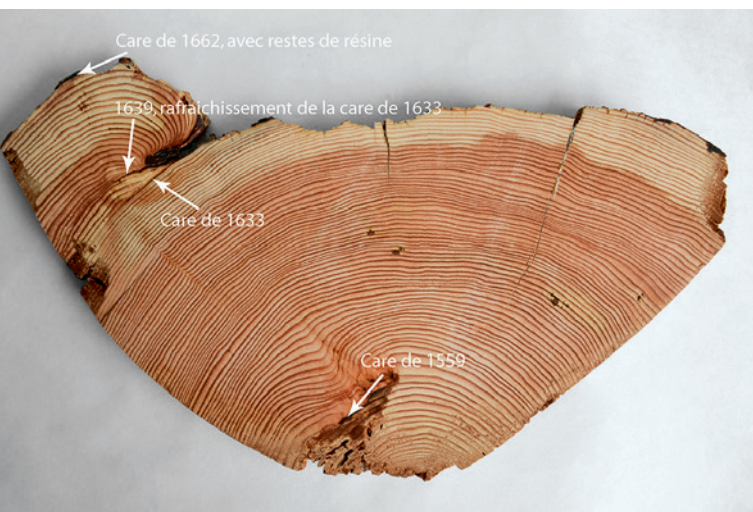
Fig. 6: Tranche BALA-62-18. A l'exception de la care de 1711, toutes les cares les plus anciennes sont visibles sur ce cliché. Les efforts de cicatrisation sont particulièrement clairs pour les années 1633 et 1639.

Quelques carottages effectués le long de la bille ont apporté les cernes les plus récents et ont ainsi permis de compléter la courbe de croissance moyenne de ce mélèze.