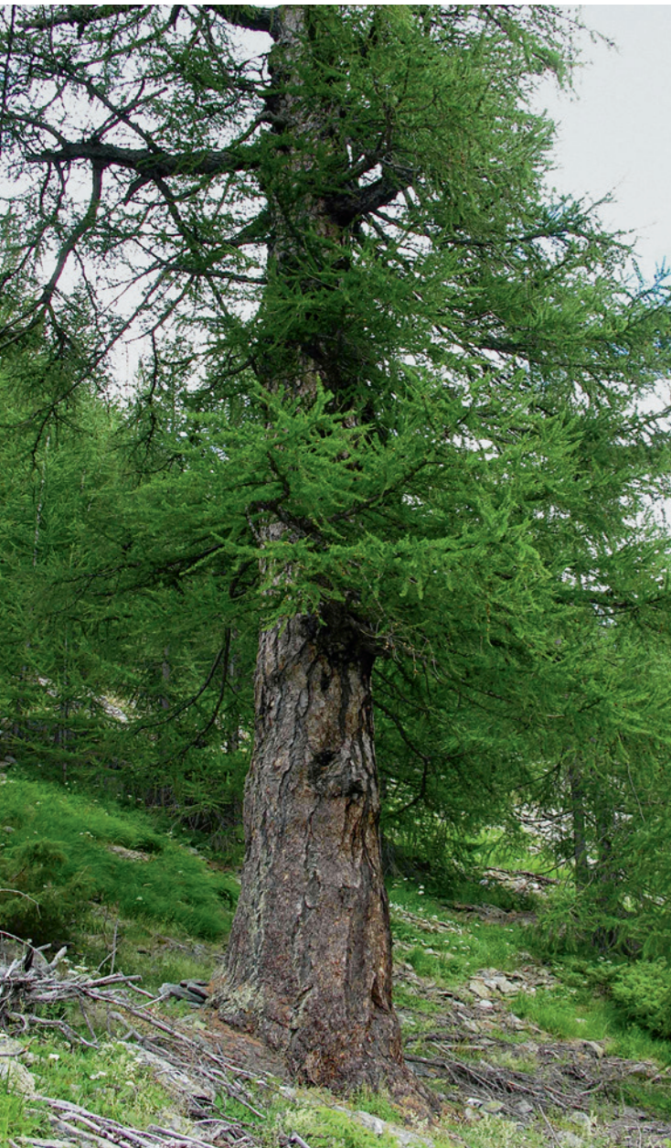
Fig. 3: Le Patriarche de Hittuwald, Simplon-Dorf (VS). Malgré son grand âge, il a près de 1000 ans, ce mélèze est en parfaite santé.