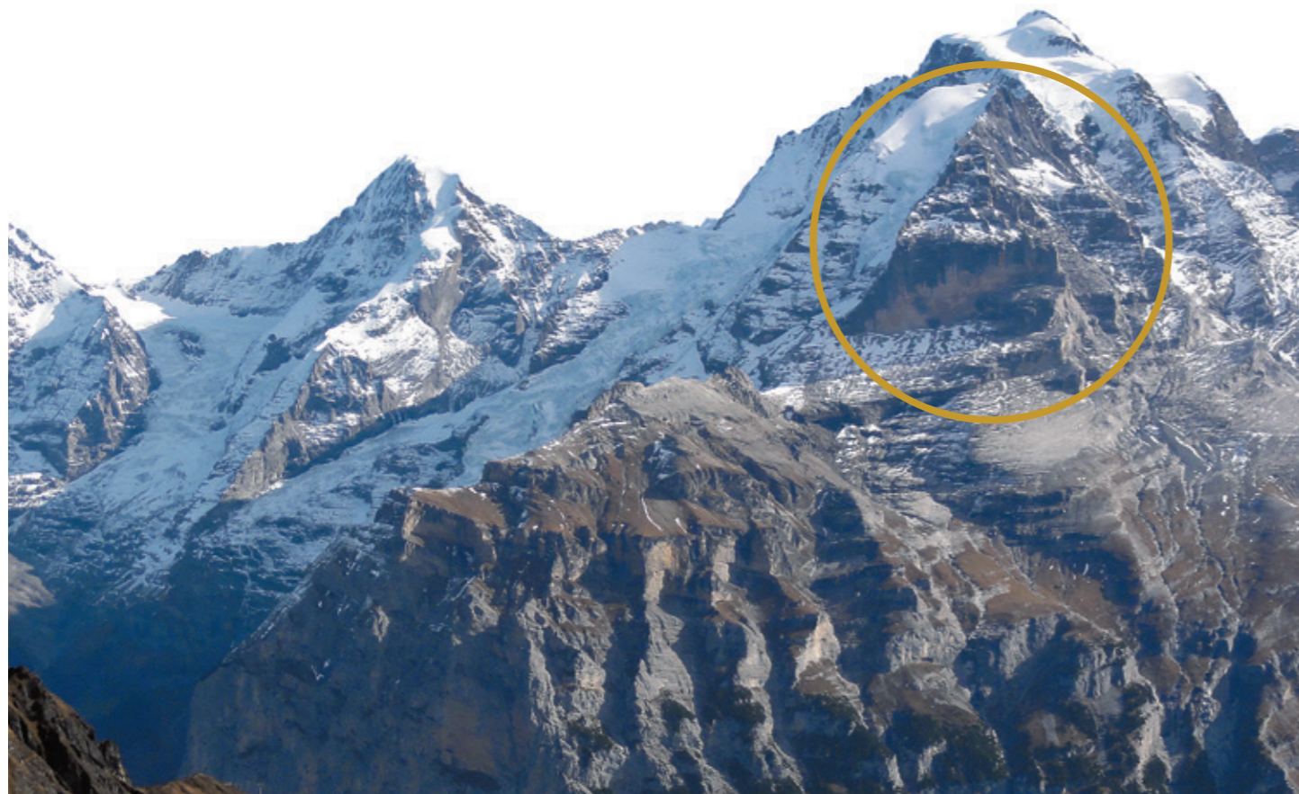
Das Rotbrätt am Fuss der Jungfrau. Im Vordergrund der Schwarzmönch .

können die Namen zum Teil nicht vom Wort Brunne «Quelle, Brunnen» unterschieden werden, das in Zusammensetzungen auch in der verkürzten Form Brunn/Brun vorkommen kann. Schliesslich kann Rot in seltenen Fällen auch von schweizerdeutsch Rod , einer gekürzten Form von Gerod , Grod «Rodung» herrühren.