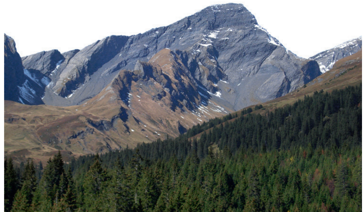
Das Schwarzhorn oberhalb Grindelwald-First.

Das Farbadjektiv schwarz weist in Flurnamen in den meisten Fällen auf schwärzliche, dunkle Färbung der Erde, des Gesteins (aufgrund der Gesteinsart, beispielsweise Tonschiefer) oder des Wassers hin. Daneben