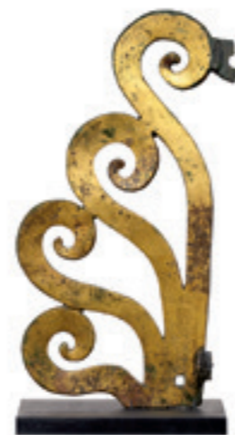
Fig. 2: Acrotère en bronze doré ornant le sommet de la toiture du temple de la Grange des Dîmes.

Si l'on pouvait remonter le temps de quelque deux millénaires et partir à la découverte des villes romaines, on serait certainement surpris de voir combien celles-ci étaient bigarrées. En effet, les édifices antiques étaient la plupart du temps rehaussés de couleurs vives et ornés de marbres polychromes. Il en va de même pour les statues de dieux, d'empereurs ou de notables sculptés dans la pierre. Celles en bronze – parfois doré à la feuille – pouvaient avoir des teintes étonnamment variées grâce à des incrustations et des techniques complexes de traitement des patines. Placées au forum, dans les cours des maisons, sous les portiques, sur les esplanades des temples, elles devaient briller sous le soleil, tout comme les quadriges ou les acrotères qui agrémentaient arcs de triomphe et toitures de monuments publics.