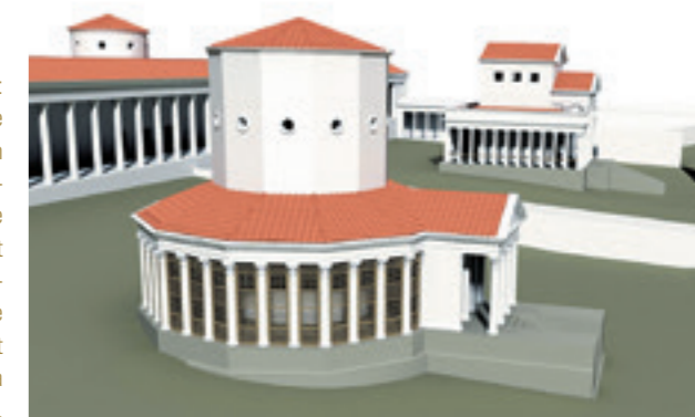
Fig. 3: Sanctuaire de la Grange des Dîmes. Proposition de restitution du sanctuaire avec le temple rond au premier plan et le temple quadrangulaire au second. L'aire sacrée est partiellement entourée de galeries à colonnades.

Parmi les bâtiments privés, nous pouvons citer le palais de Derrière la Tour, résidence de l'un des plus riches patrons d'Aventicum dont l'étendue, au début du III e siècle, avoisinait les 15 000 m 2 . Là encore, mosaïques et fresques agrémentaient les espaces (fig. 5). Des marbres importés de près de douze couleurs différentes ont été utilisés pour cet édifice de prestige: sols, parois, encadrements de fenêtres etc.