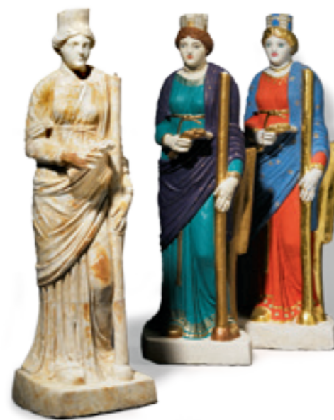
Fig. 7: Statuette en marbre de la déesse Annona (?) du sanctuaire de Thoun-Allmendingen (BE) et deux moulages en plâtre peints de la statuette.