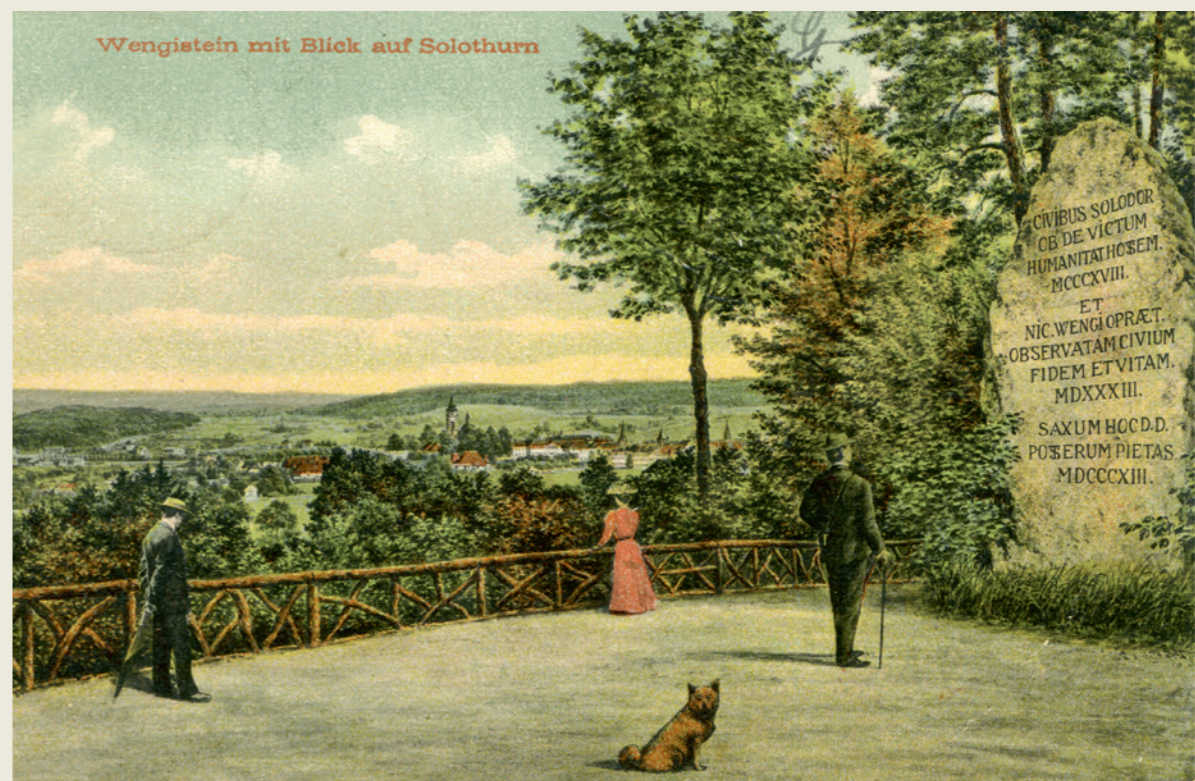
Abb. 3: Der Wengistein auf dem Känzeli mit Blick auf Solothurn, Postkarte 1908.