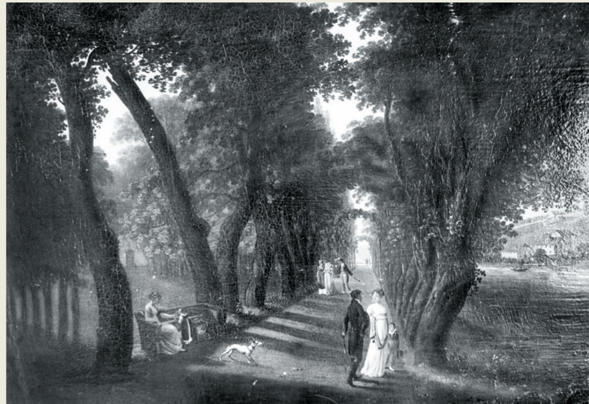
Abb. 2: Promenade im Platzspitz in Zürich, um 1815. Ölbild von Johann Caspar Rahn (1769–1840).