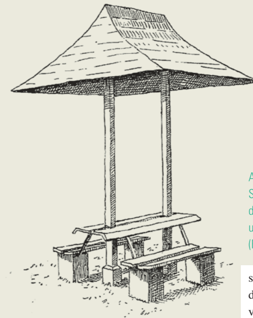
Abb. 5: Bank mit Schirmdach aus Theodor Felbers Buch Natur und Kunst im Walde (Frauenfeld 1906).