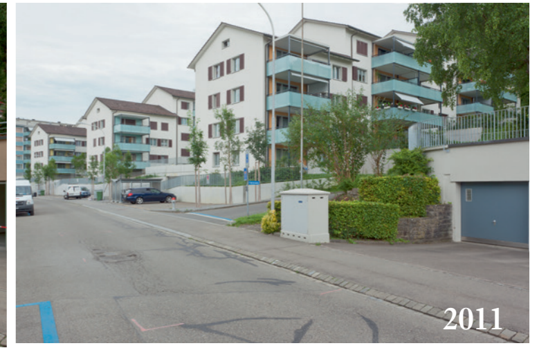
Abb. 3: Wohngebiet Kampstrasse, Blick nach Südosten: Siedlung der Gemeinnützigen Baugenos- senschaft Limmattal GLB.