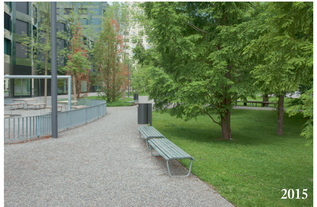
Abb. 2: Entwicklungsgebiet Rietbach, Färbi-Areal, Blick nach Westen: Überbauung «am Rietpark» (Gesamtleitung Halter AG).