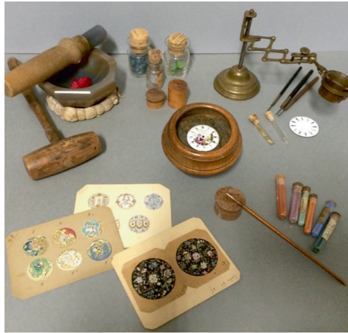
Outils de l'émailleur.

les tabatières et châtelaines: ces accessoires stimulent les talents cumulés des ciseleurs, graveurs, émailleurs, lapidaires.