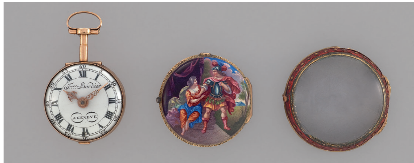
Bordier Frères, Genève, vers 1770: Montre de poche, en or, roses de diamant, émail peint, «Mars et Vénus» (haut. 6,25, diam. 4,6, ép. 2,9 cm; MAH inv. AD 282).

Dès 1625, les lapidaires et les diamantaires sont admis dans la corporation des orfèvres: ils taillent les boîtiers dans le cristal de roche pur, le cristal fumé, les gemmes (améthyste, agate, ...) ou encore le verre émaillé sur résille d'or. Ensuite, si des matériaux insolites (écaille de tortue, corne, laque) ornent les (deuxièmes et troisièmes) boîtes de protection, les métaux précieux (or et argent) sont presque exclusivement employés pour la confection des boîtes de montres, jusque tard dans le XIX e siècle.