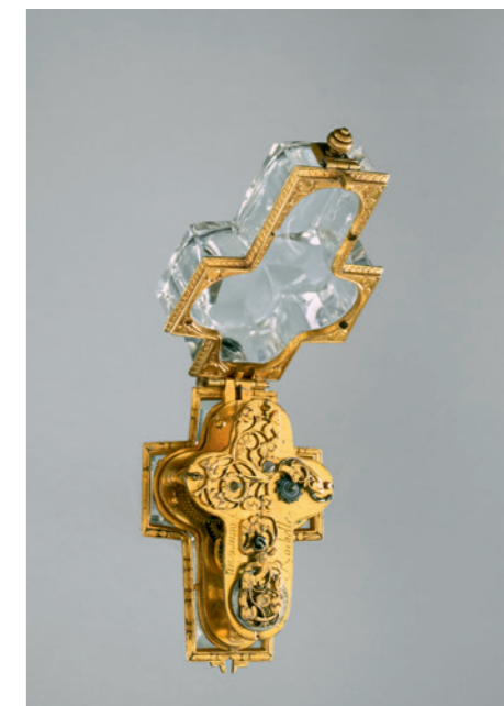
Zacharie Fonnereau, Genève, vers 1670: Montre-pendentif en forme de croix, en laiton, argent et cristal de roche, étui en argent (haut 4.5 cm, larg. 3, ép. 1.5 cm; MAH, inv. H 2008-35).