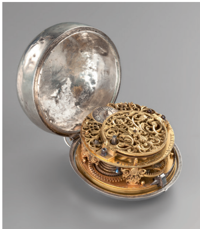
Terroux & Fils, Genève, vers 1700–1710: Montre de poche en argent, affichage du jour dans un guichet à midi (haut 7.15, diam 5.1, ép 3.25 cm; MAH, inv. N 1130).

dans lesquelles les horlogers logent d'épais mouvements à échappement à roue de rencontre. La division du travail s'accroît dès 1660: les monteuses de boîtes et les graveurs forment leurs propres maîtrises en 1698 et 1716. Les femmes, auxquelles l'accès à ces métiers reste interdit jusqu'en 1785, sont faiseuses de chaînettes et rejoignent en 1690 la Corporation des horlogers, créée en 1601. Dès la fin du XVII e siècle, les horlogers genevois achètent des ébauches dans le Jura, Pays de Gex et Faucigny: en revanche l'habillage de la montre se développe dans la cité. La division du travail y atteint, au XVIII e siècle, un stade élevé, concernant plus d'une centaine de métiers. Notons que les principales techniques décoratives sont appliquées dès l'origine tant au dehors qu'au-dedans de la montre et se traduisent par des platines gravées, piliers stylisés, coqs ciselés, plaques dorées ou bleuies repercées de motifs, ensuite ponts anglés, guillochés, perlés, vis bleuies, barillet squeletté etc.