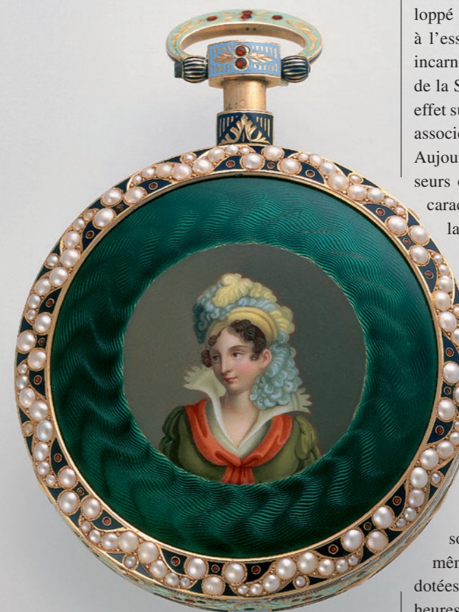
Attribuée à Piguet & Meylan, J.-F. V Dupont (peintre sur émail), Genève, vers 1820: Montre de poche dite «chinoise» à répétition, en or et émail peint, flinqué et champlévé, perles (diam. 5.6 cm, ép. 1.1 cm; MAH, inv. H 2003-138).