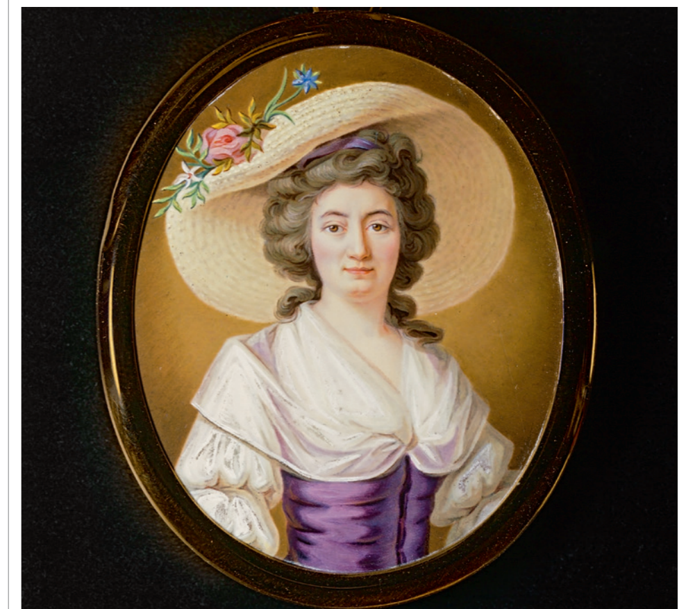
Autoportrait du peintre sur émail Elisabeth Terroux (1759–1822); peinture sur émail, 1788 (haut 6.15).

Si les acheteurs sont fascinés par l'aspect décoratif des montres, ils le sont autant par leur caractère innovant: d'où l'intégration