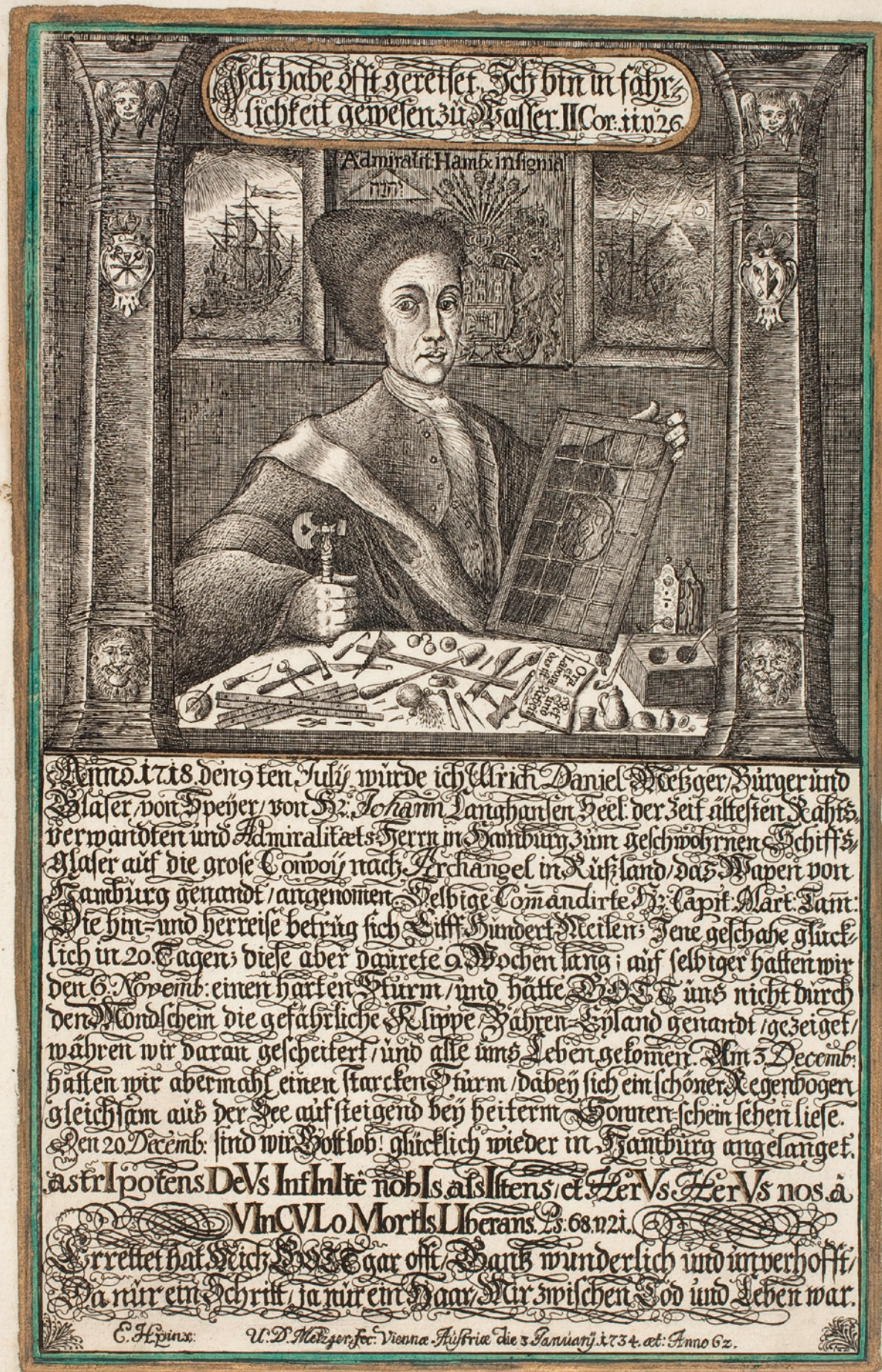
Fig. 1: Portrait d'Ulrich Daniel Metzger à l'âge de 62. Gravure à l'eau forte, partiellement colorée, datée 1734. © Wolfenbüttel, Herzog August Bibliothek, No. d'inventaire A 14054