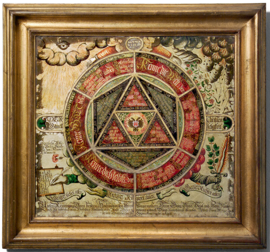
Fig. 3: Peinture sous verre d'Ulrich Daniel Metzger intitulée «Der Christen Glückseligkeit», réalisée en 1709 selon la technique de l'églomisé. Historisches Museum der Pfalz, Spire.