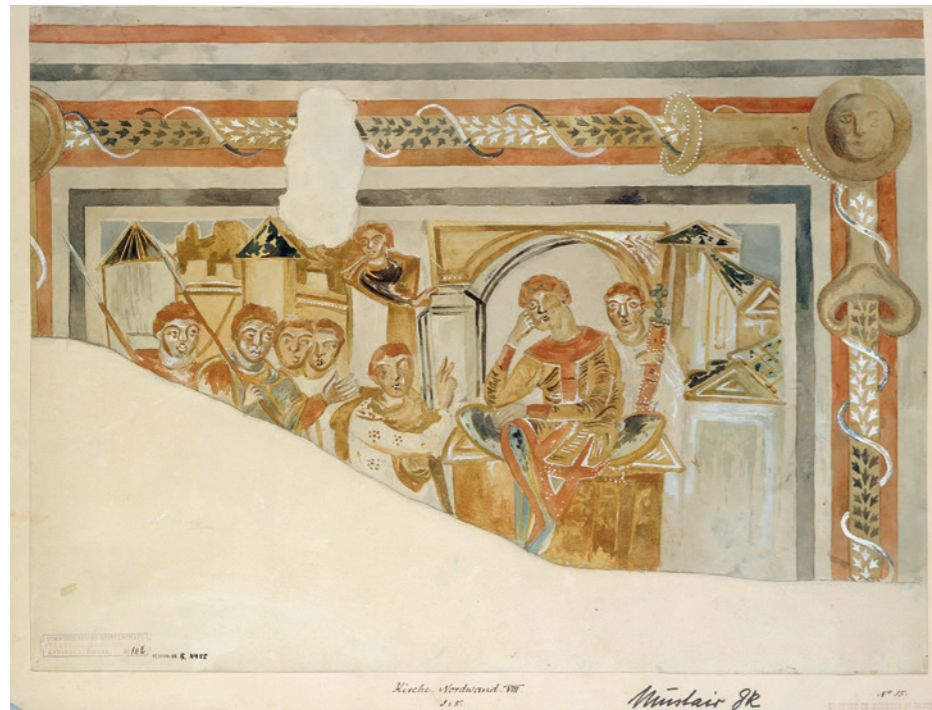
Abb. 2: Dachraum der Kirche, Bild 20: David empfängt die Nachricht vom Tode Absaloms. Aquarell von Robert Durrer. © Eidgenössisches Archiv für Denkmalpflege, Sign. EAD-102