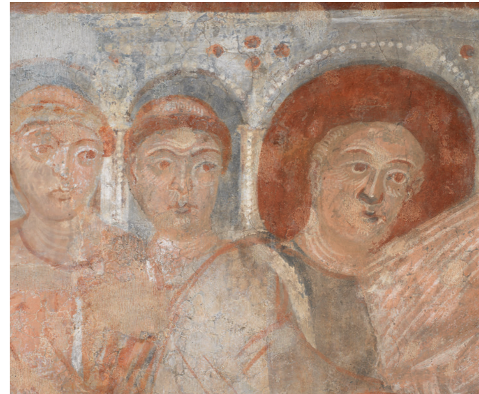
Abb. 7: Innenraum der Kirche, Südapsis, Bild Nr. 114: Ausschnitt nach der Restaurierung 2015. Erkennbar sind die charakteristischen «Krähfüsse» in den Gesichtspartien.

Jürg Goll, Matthias Exner, Susanne Hirsch (Hrsg.). Müstair: Die mittelalterlichen Wandbilder in der Klosterkirche . Zürich: NZZ Libro, 2007.