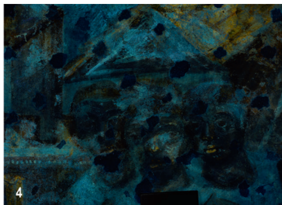
Abb. 6: Ausschnitt aus Bild Nr. 104 der Nordapsis der Klosterkirche, Multispektralaufnahmen. Von oben nach unten: Sichtbares Licht, UV Reflektanz, Infrarot Fluoreszenz, UV Fluoreszenz. Die weissen Bereiche in Bild 3 und die gelblichen Bereiche in Bild 4 deuten jeweils auf die Präsenz von Ägyptisch Blau und Mennige.