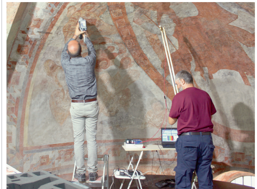
Abb. 5: Durchführung berührungsfreier Messungen (XRF und FORS) zur Bestimmung der Pigmente der karolingischen Fresken in der Mittelapsis, 2018. Zu sehen sind Mitarbeiter der Scuola Professionale della Svizzera Italiana, Lugano, und der Università del Piemonte Orientale, Alessandria.