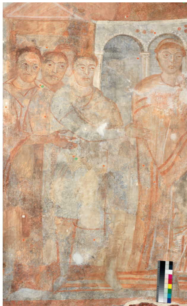
Abb. 3: Innenraum der Kirche, Südapsis, Bild Nr. 114: Ausschnitt, nach der Restaurierung 2015.

Mals wären jenen in Müstair künstlerisch überlegen. 5 Somit hatten die konservatorischen und restauratorischen Eingriffe der Jahre zwischen 1908 und 1951, die zu einem Verlust von Informationen zur ursprünglichen Farbigkeit der Fresken geführt haben, erheblichen Einfluss auf die Rezeption derselben durch die Fachleute.