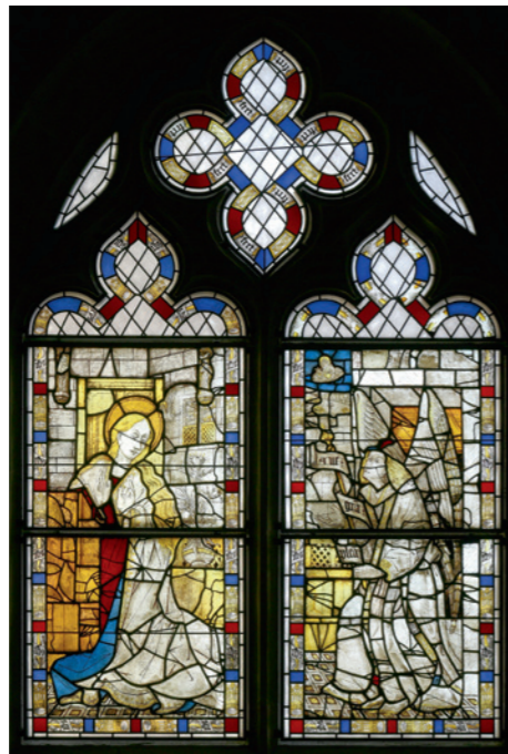
Fig. 1: L'Annonciation, vitrail créé vers 1460 par Agnus Drapeir pour la grande verrière du chœur de la collégiale de Romont.

© Service des biens culturels Fribourg, Frédéric Arnaud