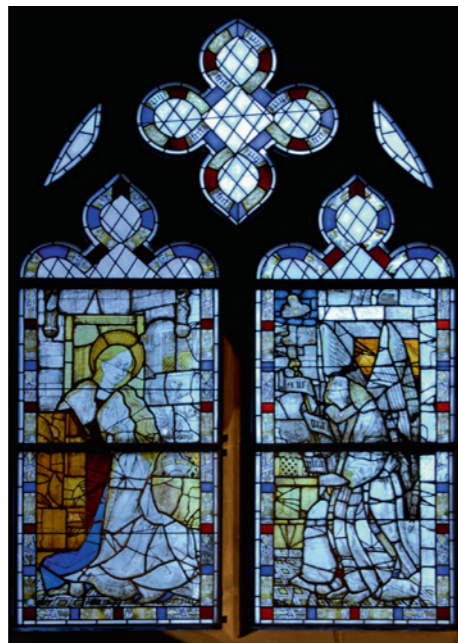
Fig. 2: Le vitrail de l'Annonciation photographié deux matins en janvier 2019 à la même heure (7h45), par ciel dégagé (à gauche, vitrail bleu), et par chute de neige (vitrail clair).