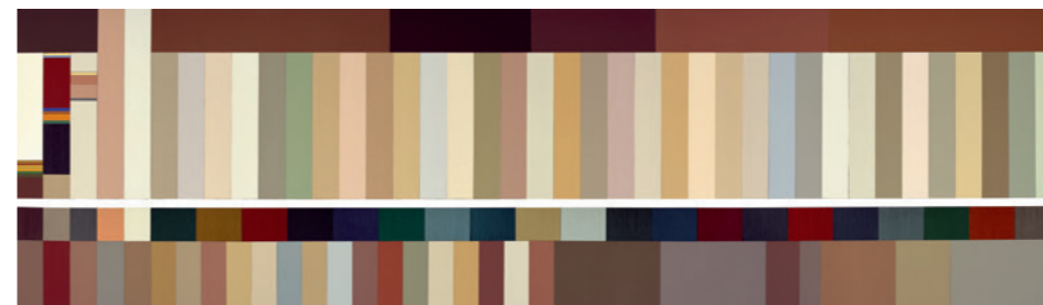
Farbkarte Rheinfelden.

Die Karte zeigt das reiche und bewegte Kolorit der schmucken Altstadt und öffnet die Augen für deren farblichen Reichtum. Die Basis der melodiosen Farbpalette bildet hier der rote Sandstein, dessen Timbre die Fassaden und die kontrastierenden Fensterläden prägt. Auf der Farbkarte von Rheinfelden sind von unten nach oben die Gewände und Sockel aus Naturstein, Fensterläden, Fenster, Fassaden und die Ziegeldächer dargestellt. ■