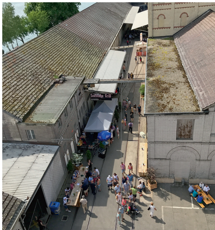
200 Jahr-Feier der Chemischen Fabrik Uetikon im Mai 2018. © Kanton Zürich, Amt für Raumentwicklung

© Kanton Zürich, Amt für Raumentwicklung