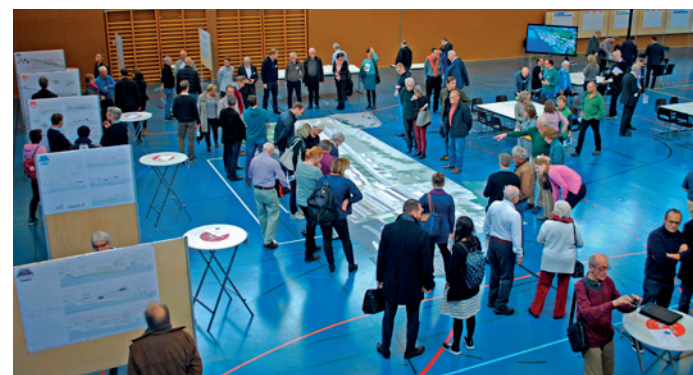
Zweite Beteiligungsveranstaltung «Chance Uetikon» zum Richtkonzept am 17. November 2018 mit begehbarem Modell und Marktständen zu einzelnen Themen.

Depuis la révision de la loi fédérale sur l'aménagement du territoire (LAT) et l'entrée en vigueur de sa stratégie de développement de l'urbanisation vers l'intérieur du milieu bâti, les mécanismes de participation ont gagné en importance dans les procédures d'aménagement du territoire. Alors que, par le passé, les questions techniques dominaient, un rôle prépondérant est désormais attribué au dialogue, à la négociation, à la coopération et à la communication. Cette nouvelle approche permet aux spécialistes de débattre des buts et de la qualité des projets avec les personnes concernées et de développer des solutions durables et susceptibles de recueillir un consensus.