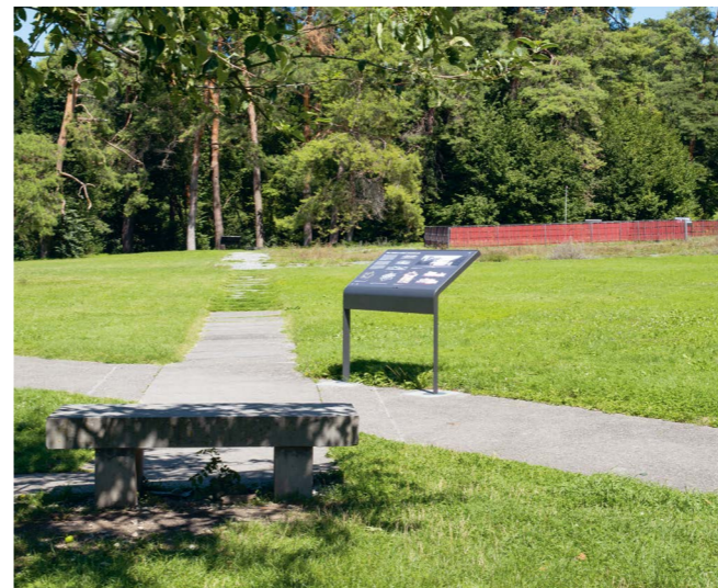
Fig. 7: Genève, Parc de la Grange. Mise en valeur des vestiges dans le cadre d'un concept d'architecture paysagère spécifique pour un agréable lieu de rencontre et de promenade.