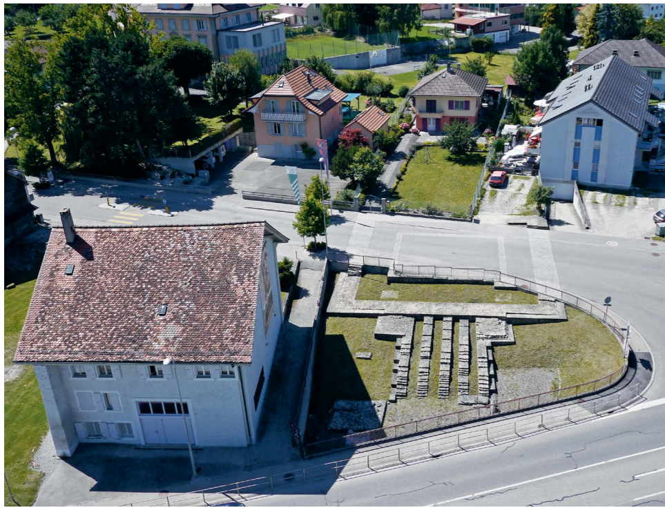
Fig. 2: Avenches/Aventicum. Vue des vestiges du temple de la Grange des Dîmes avec marquage de ses fondations.