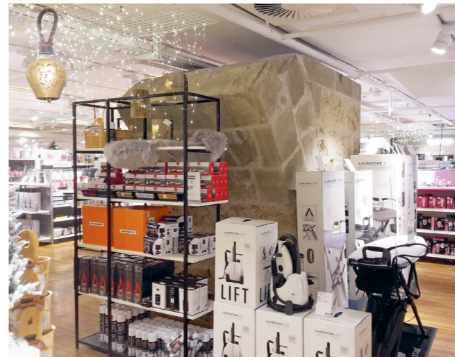
Fig. 6: Fribourg, vestiges médiévaux de la porte de Romont, au sous-sol d'un supermarché.

Andreas Mäder. «Sichtbare Pfahlbaufunde mitten in Zürich: das archäologische Fenster im Parkhaus Opéra.» Archéologie Suisse 35-3, 2012, 24-29.