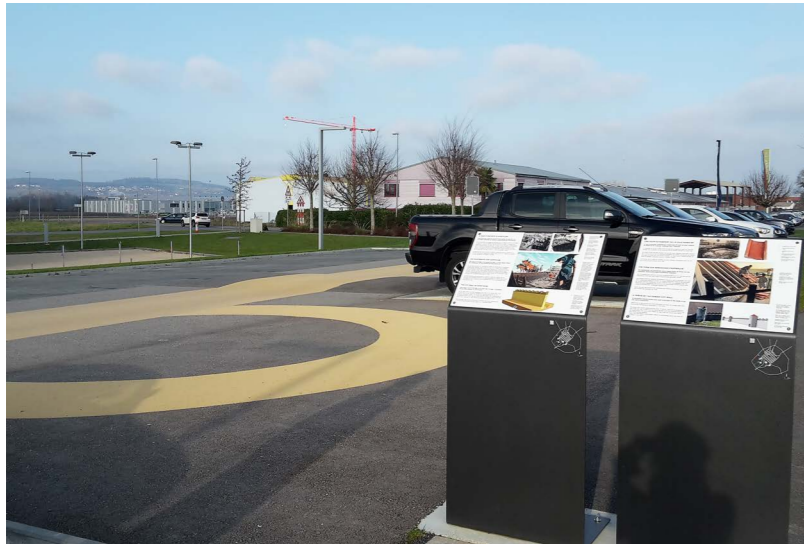
Fig. 3: Avenches/Aventicum, zone sportive. Marquage granulaire jaune du tracé du mur d'enceinte romain et de l'une de ses tours avec panneaux explicatifs.

c'est le cas notamment pour le temple de la Grange des Dîmes (fig. 2). Récemment, une nouvelle zone sportive équipée d'un parking a été aménagée en périphérie de la ville, non loin de la muraille romaine, dont le tracé, à cet endroit, n'est plus visible. Les autorités locales, le bureau d'architecture mandaté, ainsi que les Site et Musée romains d'Avenches, ont décidé d'indiquer le passage du mur romain sur une longueur d'environ 120 mètres au moyen d'un marquage granulaire jaune rappelant la couleur originale du mur en calcaire du Jura. Deux panneaux rendent les promeneurs attentifs à ce marquage, les sensibilisent au monument et leur fournissent les informations historiques indispensables (fig. 3).