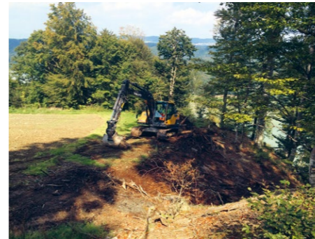
Abb. 3: Burgstelle Teuftal in der Gemeinde Mühleberg bei Bern. Freilegung der illegal aufgefüllten Ringgrabenreste durch den ADB aufgrund der Schadensmeldung von Ehrenamtlichen.