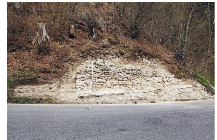
Abb. 5: Freigelegte Kapellenreste in Aeschi bei Spiez, die von einem Lokalhistoriker gemeldet wurden.