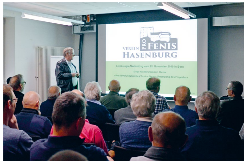
Abb. 9: Archäologienachmittag für ehrenamtliche Mitarbeitende 2019. Der Präsident des Vereins «Pro Fenis Hasenburg» stellt seinen Verein vor.