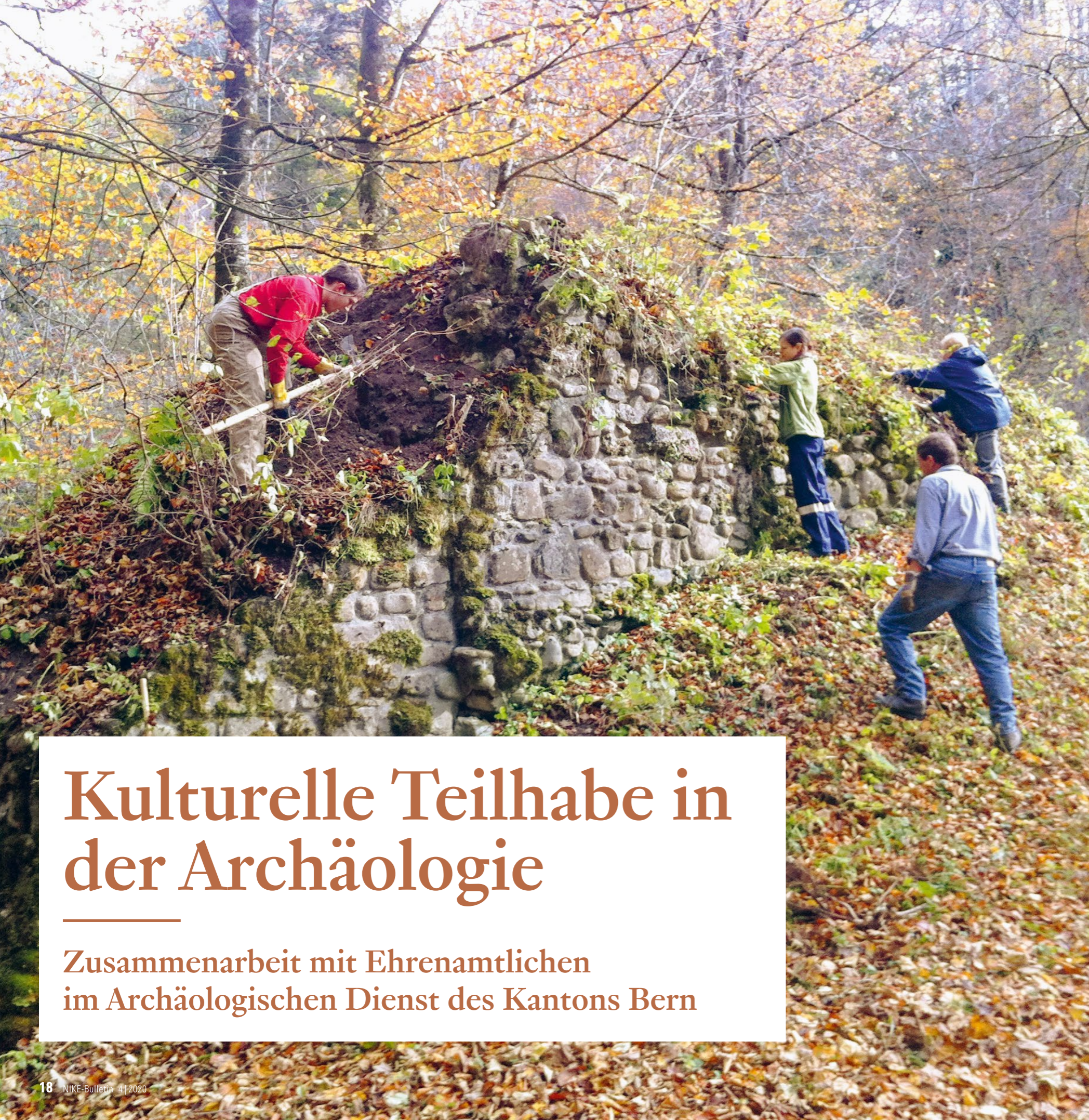
Abb. 1: Aktionstag mit freiwilligen Mitarbeitenden und dem Archäologischen Dienst (ADB) auf der Grasburg bei Schwarzenburg.

Von Judith Bangerter und Adriano Boschetti, Archäologischer Dienst des Kantons Bern, judith.bangerter@be.ch ; adriano.boschetti@be.ch