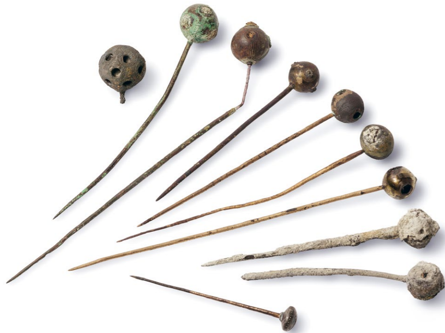
Abb. 2: Bronzezeitliche Funde aus dem Thunersee, durch einen Taucher entdeckt.