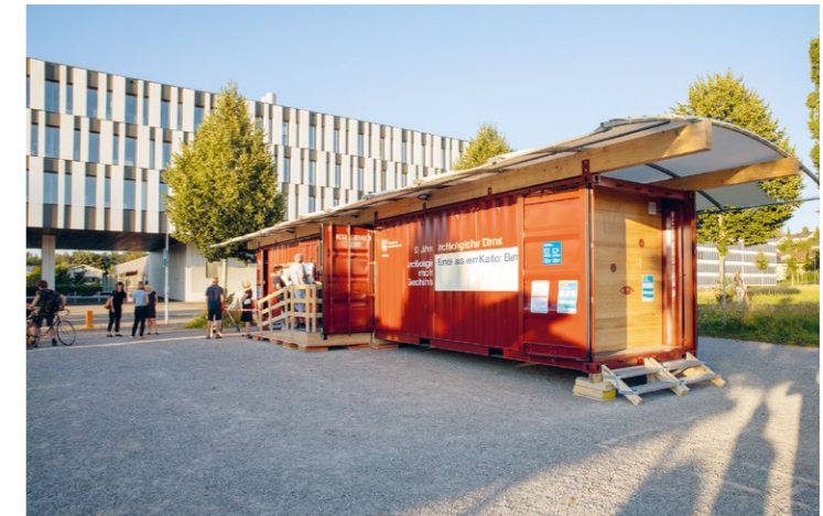
Abb. 4: Die Wanderausstellung zum 50-jährigen Jubiläum des ADB 2020 wurde mit Unterstützung von freiwilligen Helfern durchgeführt.