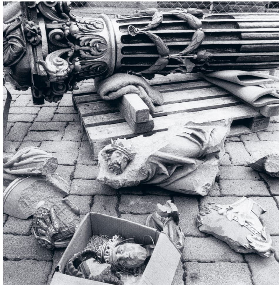
Kultureller Vandalismus im Rahmen oft ritualisierter Empörungsgesten sollte nicht mit Partizipation verwechselt werden: Nach dem Angriff auf die Justitia des Gerechtigkeitsbrunnens in Bern am 13.10.1986.