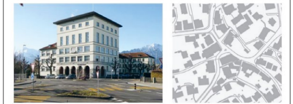
Schulhaus, Jungfraustrasse 2, Thun

Auf einem Ortsplan zeichnest du deinen Schulweg ein und markierst die Baudenkmäler, die sich auf diesem Weg befinden. Informationen dazu erhältst du von deiner Lehrperson oder auf der Seite → www.bit.ly/bauinventar-online oder auf der Gratis-App denkmappBE .