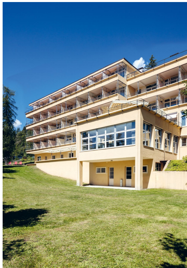
Ehemaliges Sanatorium und Hotel: Das Bella Lui in Crans-Montana (VS) wurde 1929 als Sanatorium errichtet, später als Hotel betrieben und ist nun Jugendherberge. Erbaut von Flora Steiger-Crawford, Rudolf Steiger, Arnold Itten und Rudolf Senn ist es einer der wenigen Zeugen der klassischen Moderne in den Alpen.