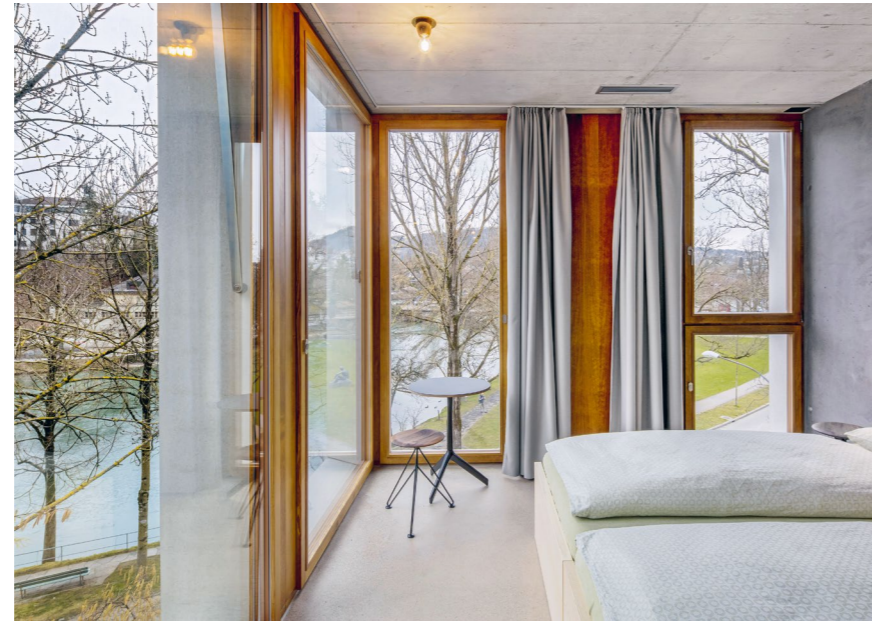
Weiterbauen im historischen Stadtbild: In der Berner Altstadt wurde die bestehende Jugendherberge, ein Gebäude von denkmalpflegerischer Bedeutung, umgebaut und erweitert. Mittels eines Architekturwettbewerbs konnte eine ausgewogene Lösung gefunden werden. Der Neubau entspricht überdies dem Minergie-Eco-Standard.