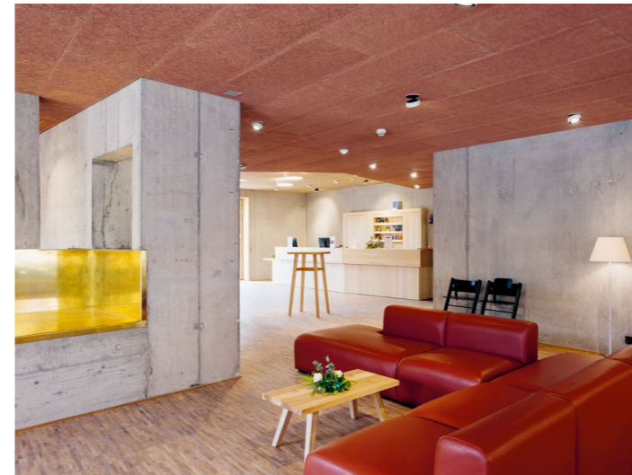
Neubau mit Ortsbezug: Die 2014 eröffnete Jugendherberge Gstaad Saanenland (BE) nimmt den örtlichen Typus des Chalets auf und interpretiert ihn neu, indem traditionelle Bauformen neu gedacht wurden. © Michel van Grondel