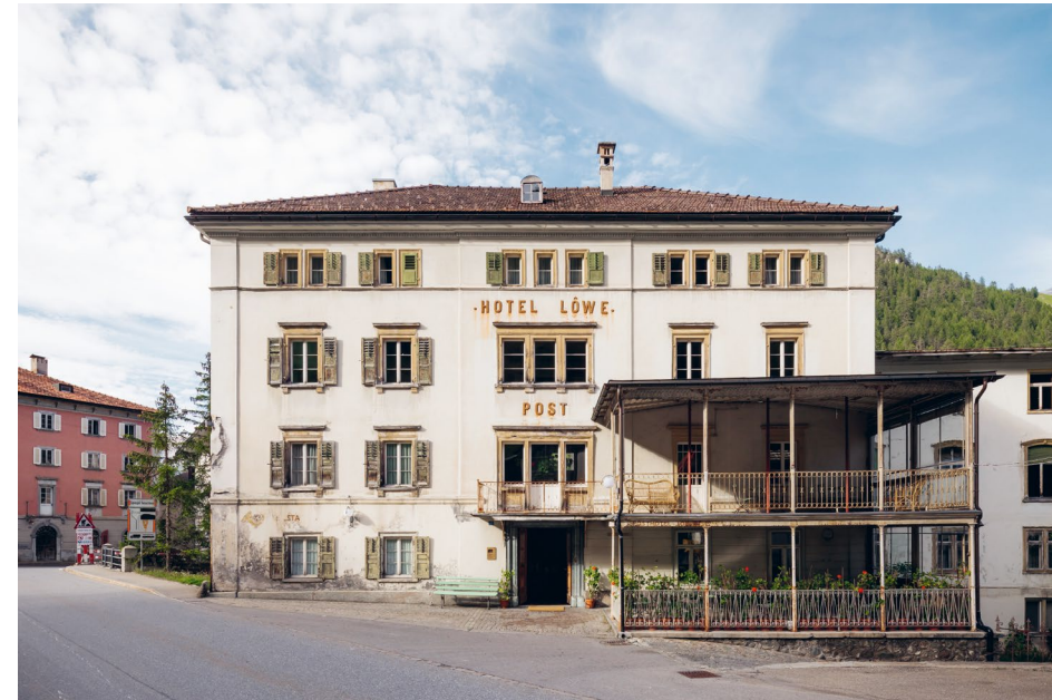
Das Post Hotel Löwen in Mulegns: Logie für Adel und Betuchte.