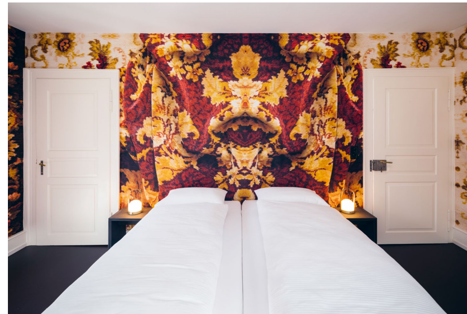
Die Innenräume mit altem Mobiliar erscheinen in neuem Gewand.