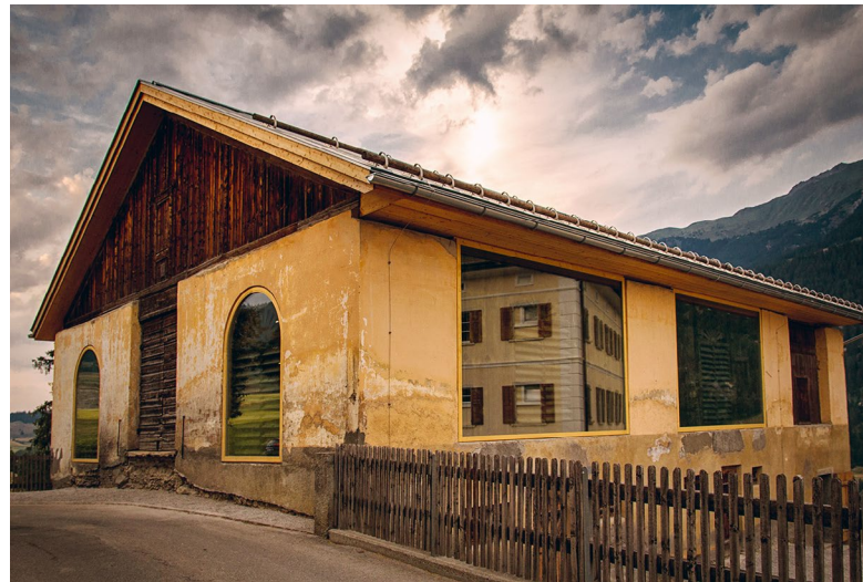
Eine Villa war Carisch nicht genug. Der imposante Stall zeugt von Reichtum. Heute wird hier Theater gespielt.