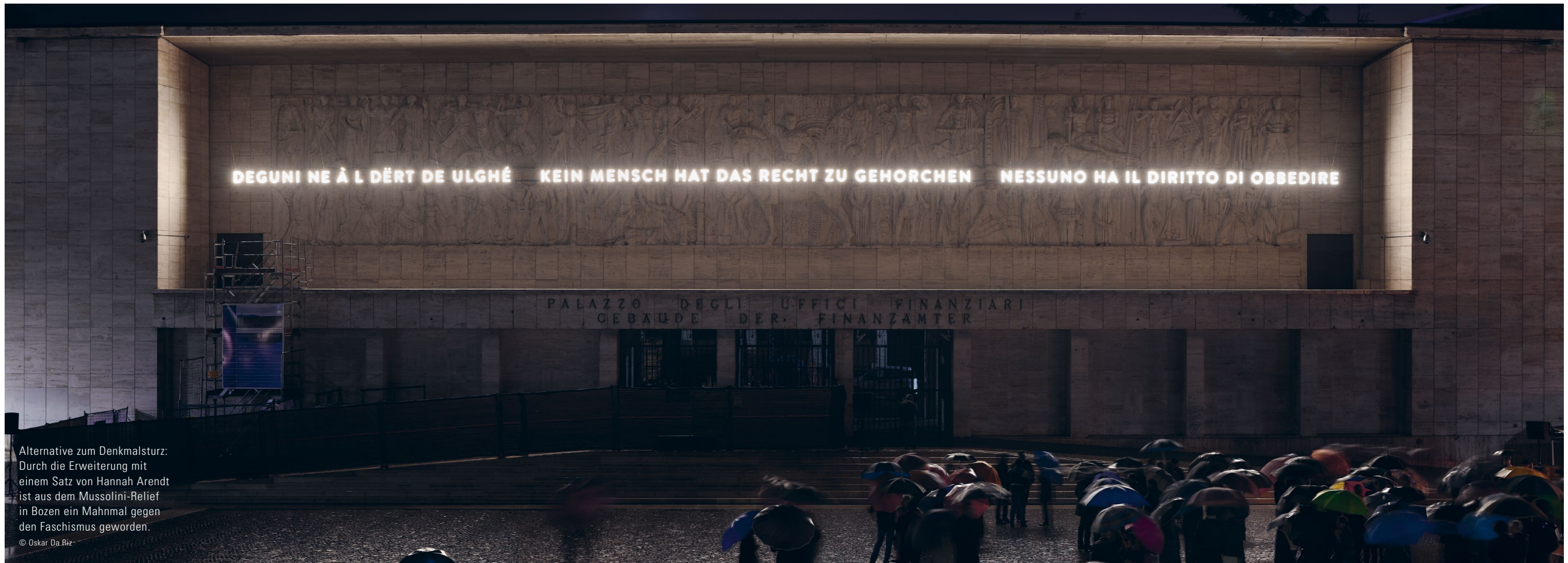
Alternative zum Denkmalsturz: Durch die Erweiterung mit einem Satz von Hannah Arendt ist aus dem Mussolini-Relief in Bozen ein Mahnmal gegen den Faschismus geworden.