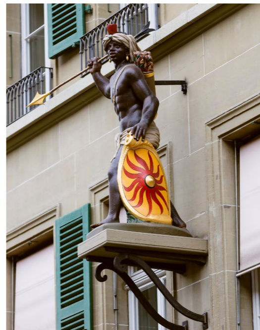
Zunftthaus zum Mohren an der Kramgasse in Bern: Das Standbild als Hauszeichen geht auf das 17. Jahrhundert zurück. Die Zunft zum Mohren ist der Zusammenschluss der Schneider und Tuchscherer.

Unbedingt. Dabei müssen die verschiedenen Standpunkte eingebracht werden. Ich erwarte aber auch von allen Beteiligten die Bereitschaft, die anderen Standpunkte zu hören und sich mit der nötigen Nüchternheit und kritischen Distanz mit diesen Standpunkten auseinanderzusetzen. Denn beleidigt sein allein reicht nicht aus. Ich meine das nicht verächtlich; ich glaube nicht, dass die Gegenwart ein absolutes Recht hat, den