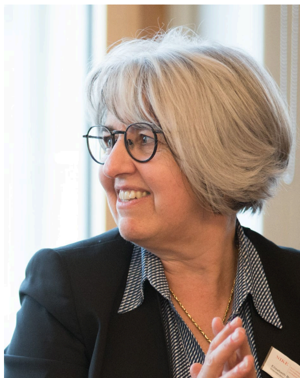
Elisabeth Baume-Schneider, Präsidentin der NIKE 2022.

Jean-François Steiert, seit 2013 Präsident der NIKE, musste sein Präsidentschaftsamt gemäss Statuten nach der dritten Amtsperiode 2022 abgeben. Mit Ständerätin Elisabeth Baume-Schneider (SP / JU) konnte eine bestens vernetzte Persönlichkeit für die Nachfolge im NIKE-Präsidium gewonnen werden. Als Präsidentin der Kommission für Umwelt, Raumplanung und Energie des Ständerates sowie als Mitglied der Kommission für Wissenschaft, Bildung und Kultur des Ständerates und der Geschäftsprüfungskommission war sie mit den politischen Themen der NIKE bestens vertraut.