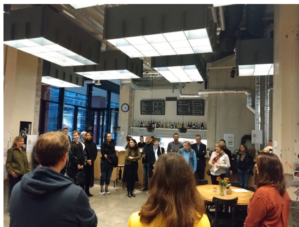
Einweihung der neuen Dachmarke am 8. November 2022 in Bern. Apéro in der Siedlung Holliger.

Der Prozess der Neukonzeption der Denkmaltage konnte dank einer grosszügigen Grundfinanzierung durch das BAK initiiert werden. Die Kosten für die Entwicklung der Dachmarke belaufen sich auf CHF 48'900. Das BAK unterstützte diese Arbeiten mit CHF 36'500, die SAGW mit CHF 5'000, die KSD 2 und die KSKA 3 mit je CHF 2'500. Für die Entwicklung der neuen digitalen Plattform benötigt die NIKE insgesamt CHF 370'000. Das BAK bewilligte einen Betrag von CHF 107'500, die Ernst Göhner Stiftung sprach CHF 40'000. Die NIKE sucht aktuell weitere finanzielle Unterstützung.