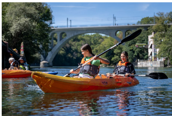
Denkmaltage 2022 in Genf: Kajak-Einführungsparcours auf der Rhône.

Die NIKE konzipierte das Kampagnenthema, war für die nationale Öffentlichkeitsarbeit verantwortlich und unterstützte die Koordinierenden der kantonalen und städtischen Fachstellen für Denkmalpflege und Archäologie. Am Jahrestreffen im November 2021 erarbeitete sie gemeinsam mit den Koordinierenden aus den Kantonen die Kampagnenschwerpunkte. Sie stellte Kulturinstitutionen und weiteren Interessierten nationales Werbematerial zu. Wie in den letzten Jahren beruhte die Werbung auf einer Mischung aus Print- und Onlinemassnahmen. Die digitale Werbung lief über die Website