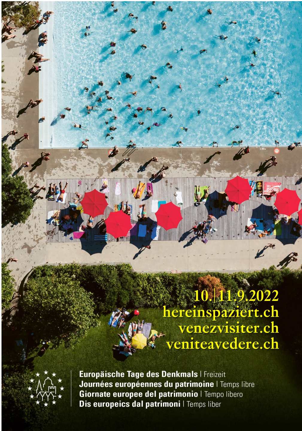
Das diesjährige Kampagnenbild ist eine Luftaufnahme des Zürcher Freibads Letzigraben von Max Frisch.