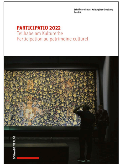
Band 8 der Schriftenreihe zur Kulturgüter-Erhaltung: Tagungsakten PARTICIPATIO 2022.

Die Tagungsakten sind im Dezember 2022 im Schwabe-Verlag Basel als Band 8 der Schriftenreihe zur Kulturgüter-Erhaltung erschienen. Sie sind in gedruckter und digitaler Form (Open Access) verfügbar und bilden zusammen mit der Tagung eine inhaltliche Weiterentwicklung des von der NIKE veröffentlichten Leitfadens «Teilhabe am Kulturerbe». Die redaktionellen Arbeiten wurden von der Geschäftsstelle der NIKE durchgeführt.